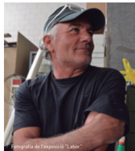
Fotografia de l'exposició "Labor"

A partir del 2 de setembre s'obre el termini per apuntar-se a la programació del Gra per als mesos d'octubre a desembre. Per als nois i noies de 12 a 18 anys, s'ofereixen tallers de dibuix manga, cant coral i màgia. I per als joves de 12 a 30, hi ha càpsules per conèixer el món del còmic (dibuix digital, fanzín, tires còmiques...) i una de quatre sessions independents per crear un còmic. Els aficionats a la cultura japonesa tenen l'opció d'aprendre'n la cuina, la tècnica de l' origami i la cal·ligrafia. Més info, www.grajove.cat