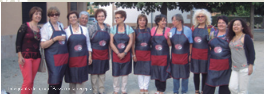
Integrants del grup "Passa'm la recepta"

Circ en família. Més info, http://llancadora.wordpress.com