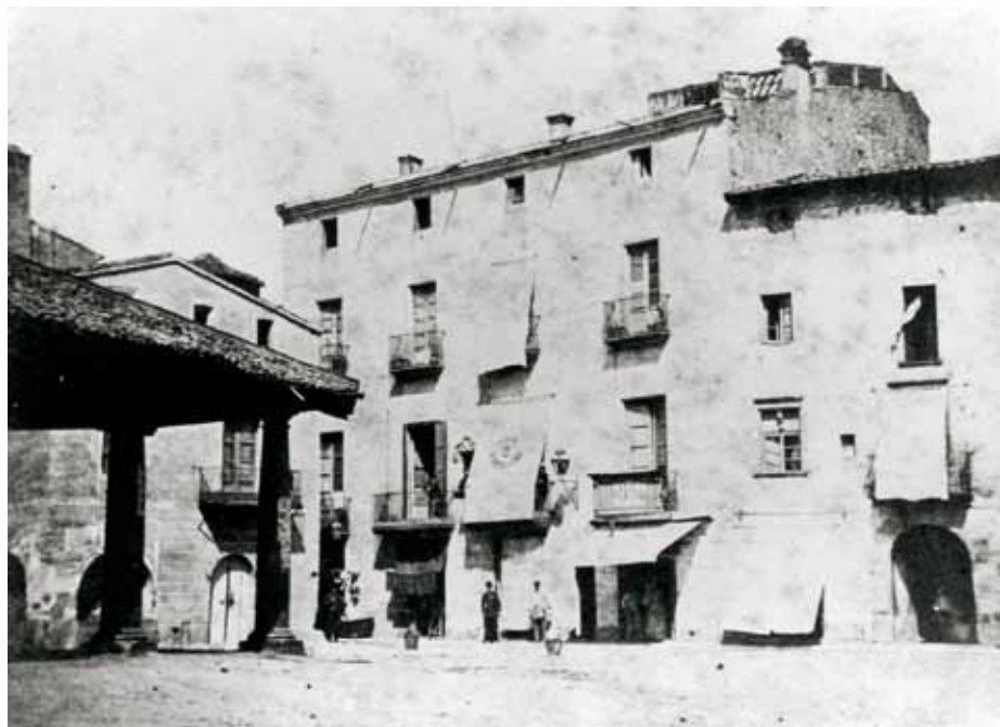
Casal dels Perpinyà-Masferrer a la pl. de la Porxada, 1878. A sota, medalla d'Anna d'Anglaterra, en commemoració de la victòria que acaba amb el setge francès de Barcelona el 1706