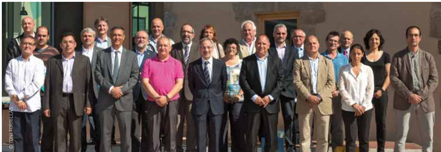
Els representants de la Xarxa C17 que han assistit a la trobada a Can Muntanyola. Centre de Serveis a les Empreses, de Granollers

La Xarxa C17, creada el novembre de 2013, s'amplia responant al compromís inicial d'integrar i sumar tots els municipis d'aquest territori que treballen conjuntament per posar en valor el patrimoni industrial, territorial i de coneixement. Aquest corredor viari i ferroviari constitueix un dels principals eixos de l'activitat productiva de Catalunya. Dels 15 municipis que formen part de la Xarxa C17, aquest estiu s'han incorporat una quinzena més. "L'objectiu és