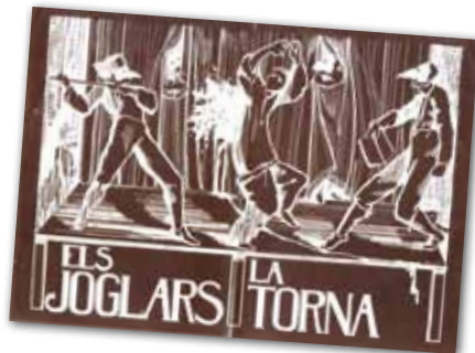
IMATGE DEL PROGRAMA DE MÀ DE LA REPRESENTACIÓ LA TORNA D'ELS JOGLARS, PRESENTADA A GRANOLLERS ELS DIES 18 I 19 DE NOVEMBRE DE 1977.

El 18 i 19 de novembre de 1977 Els Joglars van actuar al Casino-Club de Ritme de Granollers amb la polèmica obra La Torna, dins del segon cicle de teatre de l'Associació Cultural de Granollers. L'espectacle, representat a 21 poblacions espanyoles, escenificava amb màscares el cas sòrdid de la detenció, judici i execució de Heinz Chez, el vagabund polonès executat pel govern de Franco, juntament amb l'anarquista Puig Antich. Amb aquesta obra satírica, Els Joglars van desencadenar l'ira de l'estament militar, motivant un consell de guerra contra els artistes que la van representar; algun dels quals van pagar-ho amb la presó i l'exili.