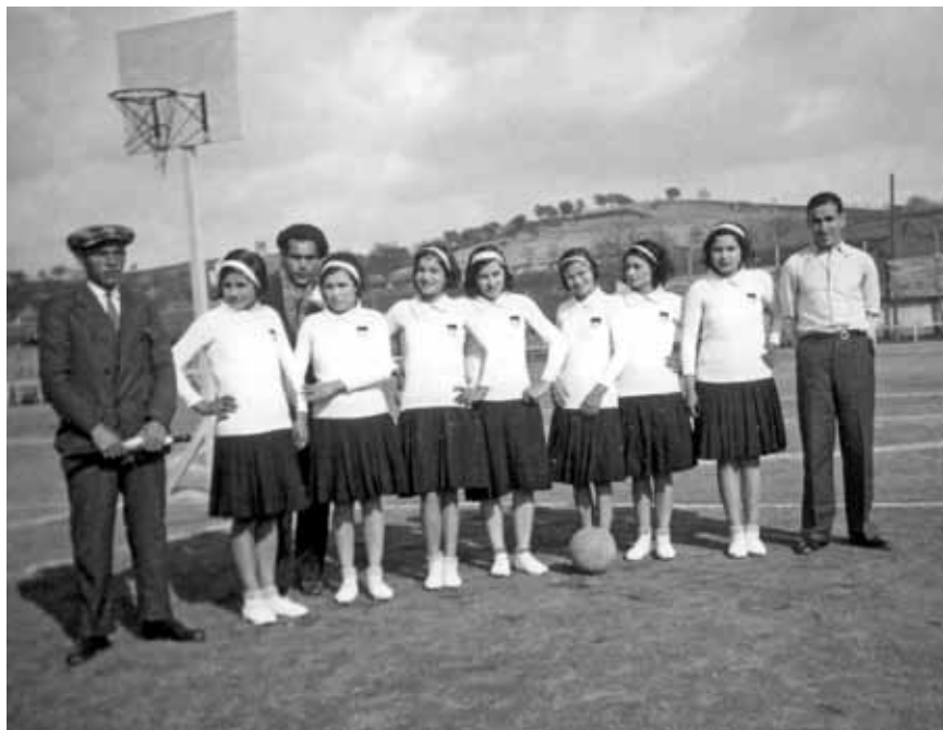
Primer equip de bàsquet femení a Granollers, 1932.

La fotografia és el fil conductor de les primeres activitats emmarcades dins el nomenament de Granollers com a "Ciutat del Bàsquet Català 2015". D'una banda, s'inaugura l'exposició "Els inicis del bàsquet a la ciutat", a la planta baixa de l'Ajuntament i, de l'altra, comença el concurs de fotografia "Granollers, Ciutat del Bàsquet Català 2015". El concurs fotogràfic, que compta amb la col·laboració de l'Associació Fotogràfica Jaume Oller té per objectiu aconseguir la participació de la ciutadania, amb la recollida d'instantànies de moments relacionats amb el bàsquet. Està dividit en tres categories: fotografia esportiva; fotografia social i "Viu el bàsquet", un concurs d'Instagram. Podeu consultar les bases a la pàgina www.cbgranollers.com .