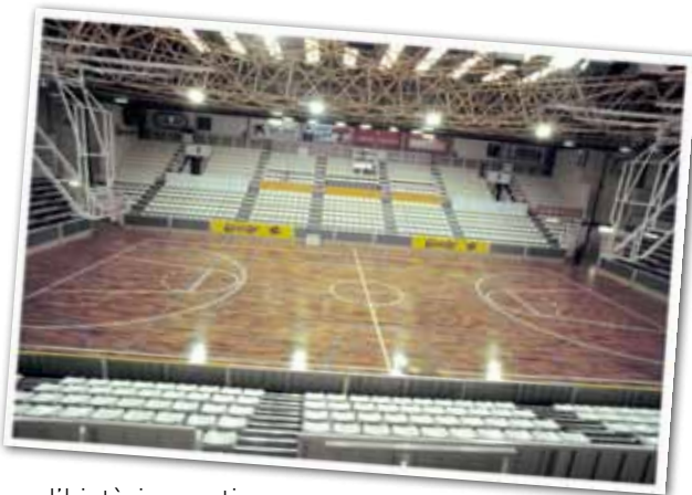
PAVELLÓ DEL CB GRANOLLERS. AUTOR I FONS: PERE CORNELLAS (AMG)

Avui, el pavelló disposa d'una pista longitudinal i tres de transversals, una tribuna per a 3.200 espectadors, espais per a vestidors i infermeria, un gimnàs amb una pista d'esquai, una sala de boxa, un espai per a la pràctica del billar, un espai de bar i zona d'administració, tres magatzems de material i una pista exterior de minibàsquet i bàsquet.