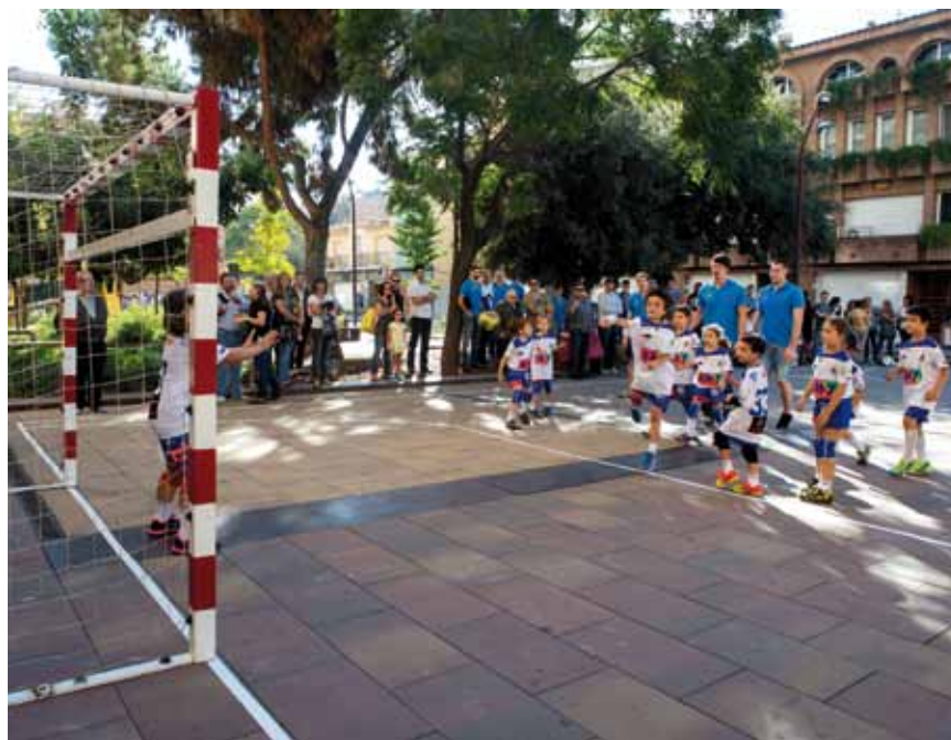
Nens i nenes jugant a handbol en la inauguració dels Jardins del BM Granollers, l'octubre passat.