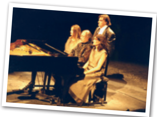
FOTO: PRIMERA REPRESENTACIÓ AL TEATRE, L'ÒPERA EN LLATÍ DE "RICARDO I ELENA" DEL COMPOSITOR I PIANISTA CARLES SANTOS

El 15 de febrer fa 15 anys que es va inaugurar el Teatre Auditori de Granollers, un equipament llargament esperat per la ciutat perquè les obres van començar el 1987, posteriorment es van aturar i després es van reprendre amb força gràcies a l'aportació de les administracions i, sobretot, d'una trentena de patrocinadors. El teatre va obrir les seves portes amb una capacitat superior a les 800 butaques.