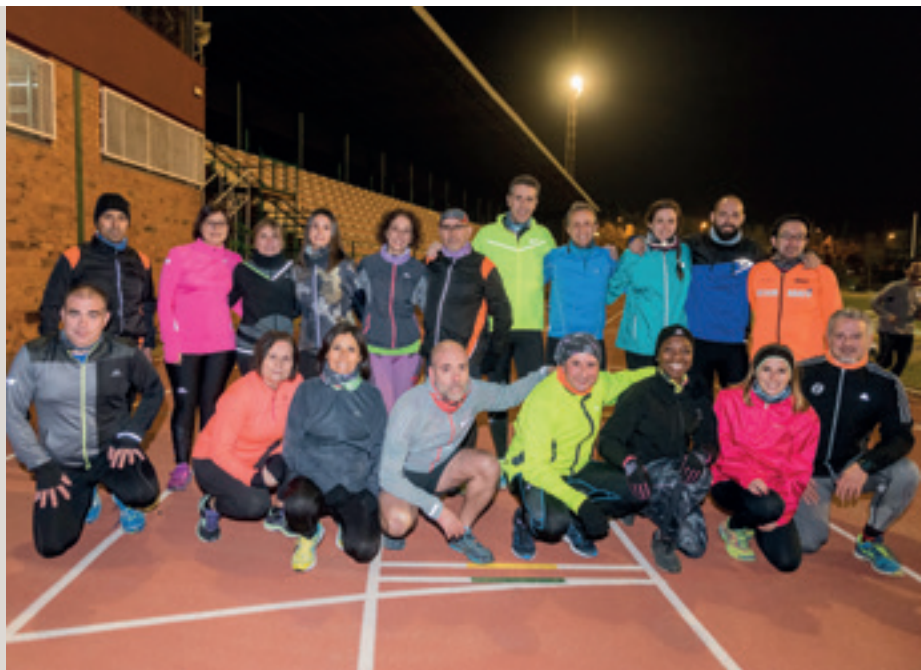
L’Esther, a finals de gener, amb els companys i companyes amb els quals entrena, a punt de sortir a córrer des de les pistes d’atletisme. De compartir curses i entrenaments ha sorgit l’amistat.

La Mitja és l’esdeveniment més internacional de