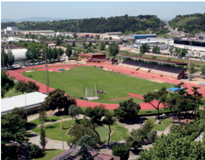
Personal dels equipaments esportius, persones i entitats usuàries intentaran reduir els consums d'electricitat, gas i aigua durant el mes de febrer. L'estalvi s'invertirà en accions contra la pobresa energètica

Gràcies a l'estalvi de 16.000 euros aconseguit en la Marató de l'Estalgia de l'any passat,