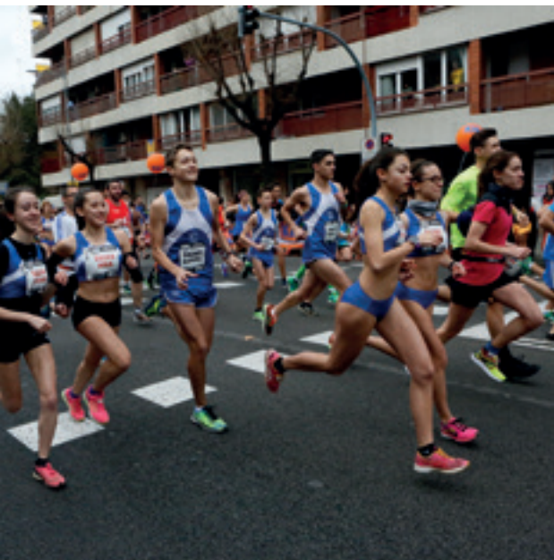
Entre la Mini, la cursa dels 5 km, la dels 10 km i la Mitja es reüniran a Granollers més d'11.000 atletes d'arreu.