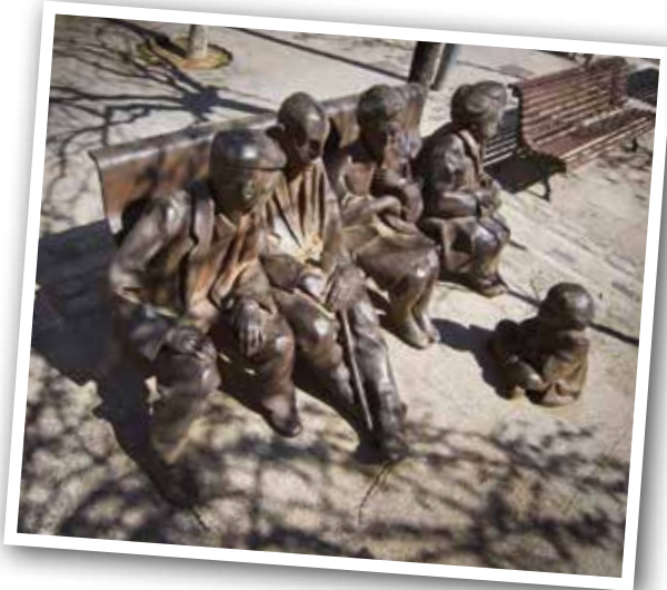
DES DE 1996 LA PLAÇA JAUME I, AL COR DEL BARRI DEL LLEDONER, ACULL UNA ESCULTURA QUE HOMENATJA LA VELLESA. INCORPORA AQUESTA INSCRIPCIÓ: LA JOVENTUT NO ÉS UN TEMPS DE LA VIDA ÉS UN ESTAT DE L'ESPERIT.

Posteriorment, el 1928, el municipi de Palou es va fusionar amb Granollers. Des d'aleshores el terme municipal de Granollers s'ha mantingut invariable.