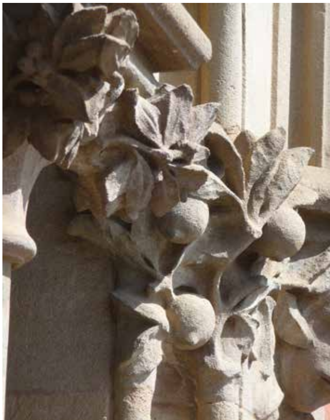
Detall vegetal de la façana de l'Ajuntament de Granollers.

Una altra proposta és l'itinerari "Patrimoni + natura+ poesia" pels elements patrimonials –sobretot, modernistes– inspirats en la natura més destacats de la ciutat: Casa Torrabadella, Can Margarit, Can Déu, Casa Blanxart, Can Ganduxer, Can Puntetes i l'Ajuntament, cases i edificis molt coneguts i plens de detalls. L'activitat es farà el diumen-