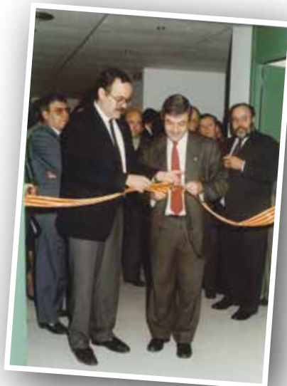
INAUGURACIÓ DE LA SEU DEL CONSELL COMARCAL AL CARRER RICOMÀ, 1991.