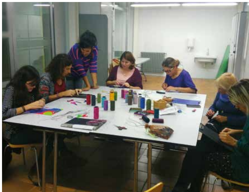
Participants al curs de joieria en macramé el primer quadrimestre d'aquest curs.

El curs 2016/17, la Xarxa de Centres Cívics (XCC), integrada pels equipaments de Can Basa, Can Gili, Palou, Jaume Oller i Nord, va tenir un total de 74.875 usos, lleugerament inferior