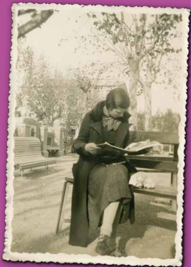
Noia llegint al parc de l'Estació, any 1935. Imatge del cartell municipal amb motiu del 8 de Març

La programació del Dia Internacional de les Dones difondrà el rol que van jugar les dones en la rereguarda de la Guerra Civil