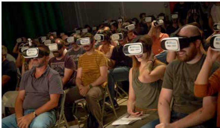
Una de les activitats del MAC 2017