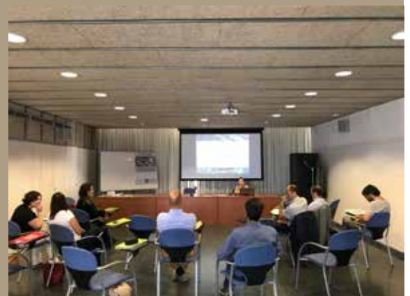
La trobada de Thermos va tenir lloc els dies 20 i 21 de setembre al Centre Tecnològic i Universitari de Roca Umbert. A més dels representants de Cascais, hi van participar membres d'ICLEI Europa, l'organisme que aplega els governs locals per la sostenibilitat, i de la consultora d'eficiència energètica CREARA.

L'estalvi energètic i en emissions d'una xarxa així seria un gran pas per a la transició energètica a Granollers, ja que el consum industrial representa la meitat de tot el consum energètic de la ciutat. Quan parlem de transició energètica parlem d'un canvi en la producció de l'energia, que substitueixi els combustibles fòssils (gas, petroli...) per fonts renovables i locals. Però també d'una nova manera de gestionar i utilitzar l'energia, incrementant-ne l'ús compartit i fent-ho de manera més eficient. En aquesta línia treballa Thermos. La darrera trobada amb els socis portuguesos va servir també per visitar el Parc de l'Alba a Cerdanyola, i les empreses Districlima de Barcelona i Tub Verd de Mataró, exemples de distribució d'energia més sostenible.