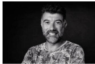
PEP PLAZA... I ARA MÉS!