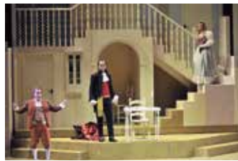
EL BARBER DE SEVILLA