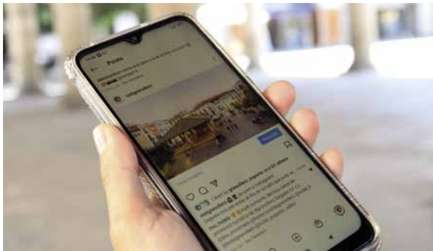
El nou perfil d'Instagram @visitgranollers és la nova xarxa oficial de promoció turística de la ciutat

L'Ajuntament de Granollers ha engegat una campanya de promoció de la ciutat adreçada al turisme de proximitat amb l'objectiu de millorar-ne el posicionament, augmentar l'ocupació hotelera i incrementar la despesa diària dels visitants en comerços i equipaments. Es tracta d'una de les actuacions previstes en el Pla de mesures socioeconòmiques per pal·liar els efectes negatius de la crisi de la Covid-19, aprovat el 26 de maig de 2020. La campanya s'ha desenvolupat amb la col·laboració de l'Associació d'Hotels del Vallès Oriental i amb l'assessorament de l'empresa Aqa Consulting. Va dirigida al turisme familiar, cultural i de negocis, provinent de Catalunya, comunitats autònomes properes de la resta de l'Estat i del