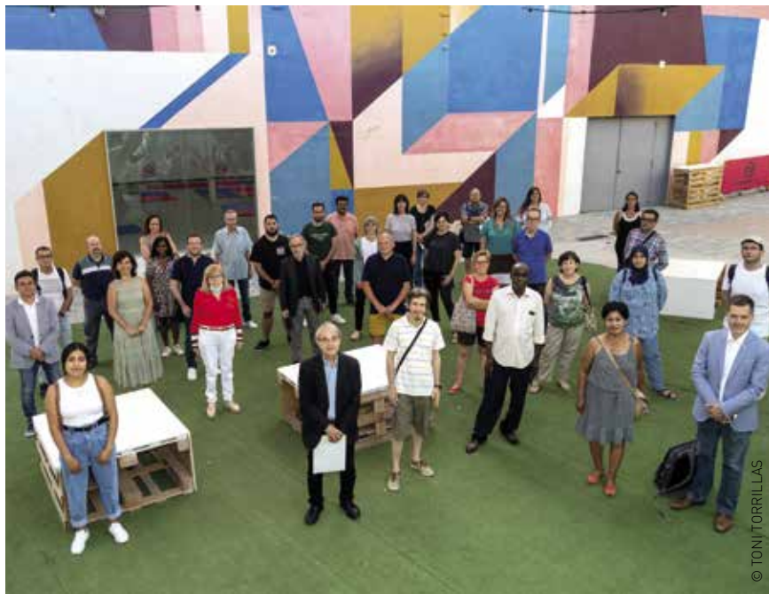
Fotografia de grup de la nova composició del Consell de Ciutat

El passat 12 de juliol es va celebrar, al Centre d'Arts en Moviment (Roca Umbert), una nova sessió plenària del Consell de Ciutat, i ha estat la primera sessió feta presencialment des del mes de març de 2020.