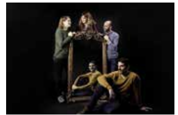
BOIRA A LES ORELLES