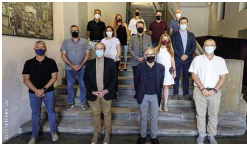
Representants dels municipis del Vallès Oriental signants d'aquest conveni de col·laboració

La presència de senglars en àrees urbanes i periurbanes és cada cop més freqüent i pot produir danys a cultius, accidents de trànsit, atacs a animals domèstics o malmetre parcs, jardins i mobiliari urbà. L'Ajuntament de Granollers va promoure l'abril de 2019 una primera trobada tècnica a Palou amb ajuntaments de l'entorn i experts per tal de treballar conjuntament, com a territori, la problemàtica. D'aquesta reunió en va sorgir la necessitat de signar un conveni per planificar diverses accions coordinades i reduir els problemes que produeix la presència de senglars a 14 municipis del Vallès Oriental. El passat 14 de juliol es va presentar a Granollers aquest conveni de col·laboració interadministrativa entre els ajuntaments de Bigues i Riells, Caldes de Montbui, Canovelles, Granollers, l'Ametlla del Vallès, les Franqueses del Vallès, Lliçà d'Amunt, Lliçà de Vall, Martorelles, Montmeló, Montornès del Vallès, Parets del Vallès, Santa Eulàlia de Ronçana i Vilanova del Vallès.