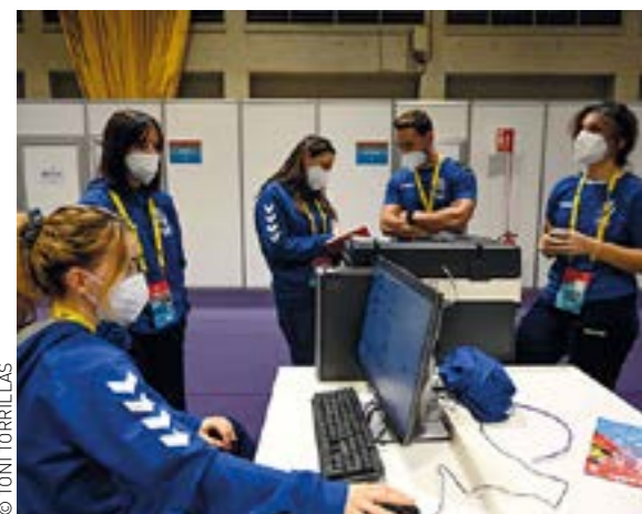
Un Mundial és impossible de gestionar sense la col·laboració de les persones voluntàries. Gairebé 500 van ajudar en diferents tasques, com les que van assistir els mitjans de comunicació o les que elaboraven continguts de comunicació