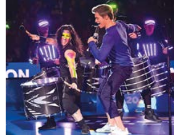
El cantant Carlos Baute va interpretar en la cerimònia de cloenda Lala Gol , la cançó oficial del campionat del món