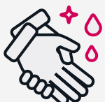
RENTEU-VOS LES MANS SOVINT