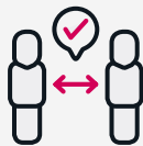
MANTENIU LA DISTÀNCIA DE SEGURETAT DE 2 M ENTRE PERSONES