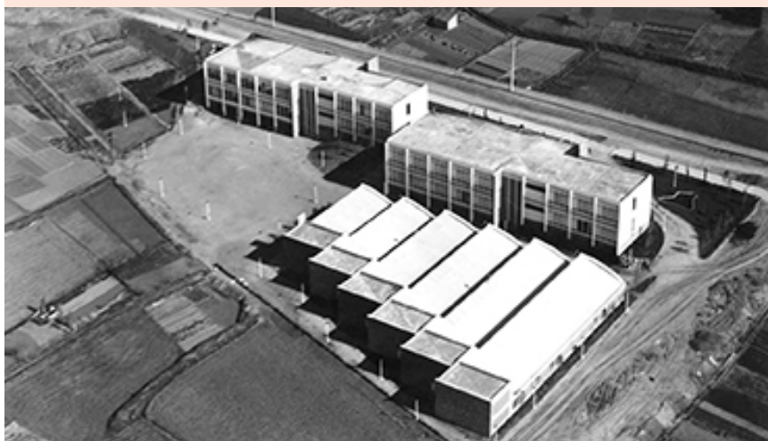
Escola Municipal del Treball, 1962. Vista aèria de l’escola un cop finalitzada la construcció al carrer de Roger de Flor, amb la cantonada de l’actual carrer de Joan Camps. La inauguració oficial va ser el 14 d’octubre de 1962.

Sala Zero. Roca Umbert FINS AL 3 D’ABRIL Joan Pallé. “Contes immorals”