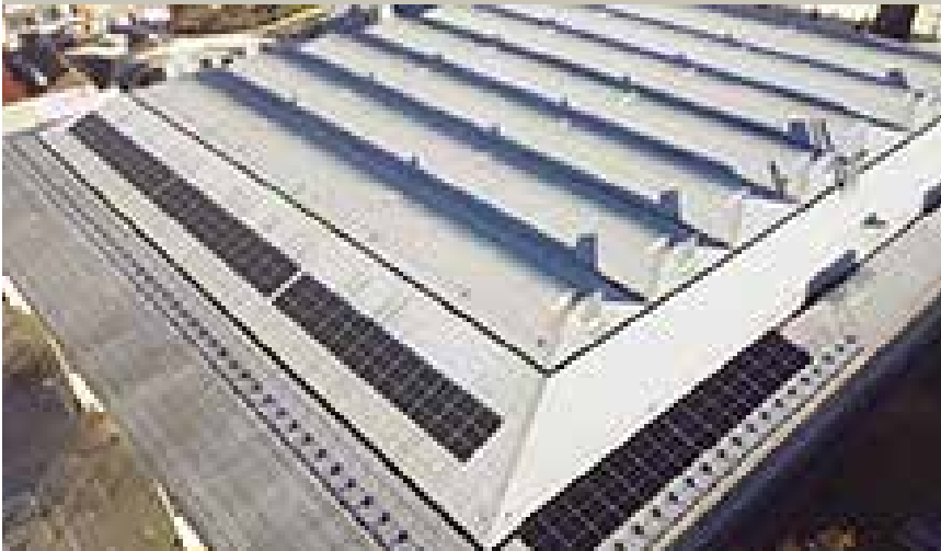
Imatge de les plaques fotovoltaïques del Palau d'Esports

L'Ajuntament continua compromès amb el foment de la transició energètica per fer front a l'emergència climàtica, un dels reptes principals de Granollers per al 2030 que planteja el Pla Estratègic.