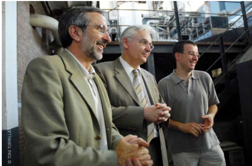
El conseller de Cultura es va interessar pel projecte global de Roca Umbert

Roca Umbert Fàbrica de les Arts és un gran projecte cultural que reconverteix l'antiga fàbrica tèxtil Roca Umbert en un nou model d'equipament cultural públic amb vocació local i supramunicipal, a l'abast per cobrir les necessitats dels sectors artístic, comunicatiu i tecnològic.