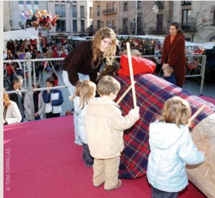
El Tió Solidari, una manera de col·laborar a omplir el rebost del Xiprer

De fet, el magatzem d'aliments dóna resposta a una reorganització de la distribució d'aliments que es feia a cada parròquia. Hem unificat tota la recollida i compra d'aliments d'una forma unitària a fi d'abaratir costos i fer més rendible i eficaç els recursos econòmics de què disposem. Així, els aliments que avui es distribueixen en aquesta zona, dels quals se'n beneficien