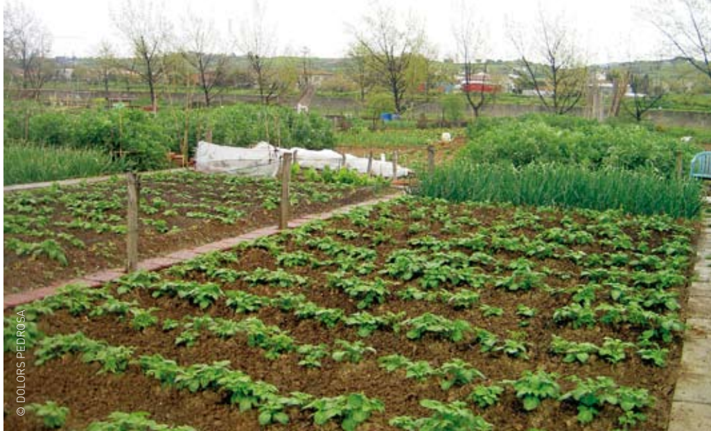
Els horts municipals reduiran el consum d'aigua amb la nova xarxa de reg per degoteig

El centenar de parcel·les que conformen els horts municipals, entre els camins de Parets i Can Ninou, també veuran reduït el consum d'aigua fins a un 85 % quan l'any vinent finalitzin les obres d'implantació de la nova xarxa de reg per degoteig. Aquest projecte ha estat guardonat en la 3a edició dels Premis a la millor iniciativa local per l'estalvi d'aigua, organitzat per la Diputació de Barcelona. No és el primer reconeixement a la política ambiental municipal que rep l'Ajuntament: el 2004 també la Diputació va reconèixer amb el Premi a la millor iniciativa local el projecte de la creació de la xarxa no potable, a més de l'actuació de sanejament i rehabilitació ambiental del riu, que també van ser qualificades com a bones pràctiques per un comitè tècnic de les Nacions Unides.