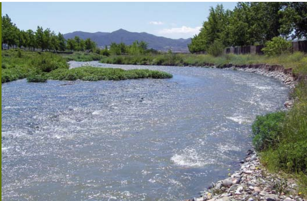
El riu Congost

El mes de gener les previsions ens anunciaven un estiu calorós com pocs. L'hivern ens ha dut poca neu i pluja. Paral·lelament, els mitjans de comunicació ens informen de fenòmens meteorològics que evidencien que el canvi climàtic és una realitat. Són senyals d'alerta que requereixen una resposta compromesa de tothom: administracions, empreses i ciutadania. Un dels elements bàsics a preservar és l'aigua, un bé tan necessari com escàs. En aquest reportatge es relacionen algunes de les actuacions que s'estan portant a terme a Granollers per millorar la qualitat de l'aigua i fer-ne un ús més racional. També s'ofereixen alguns consells que podem practicar en el nostre àmbit quotidià. El medi ambient i la nostra butxaca ho agrairan.