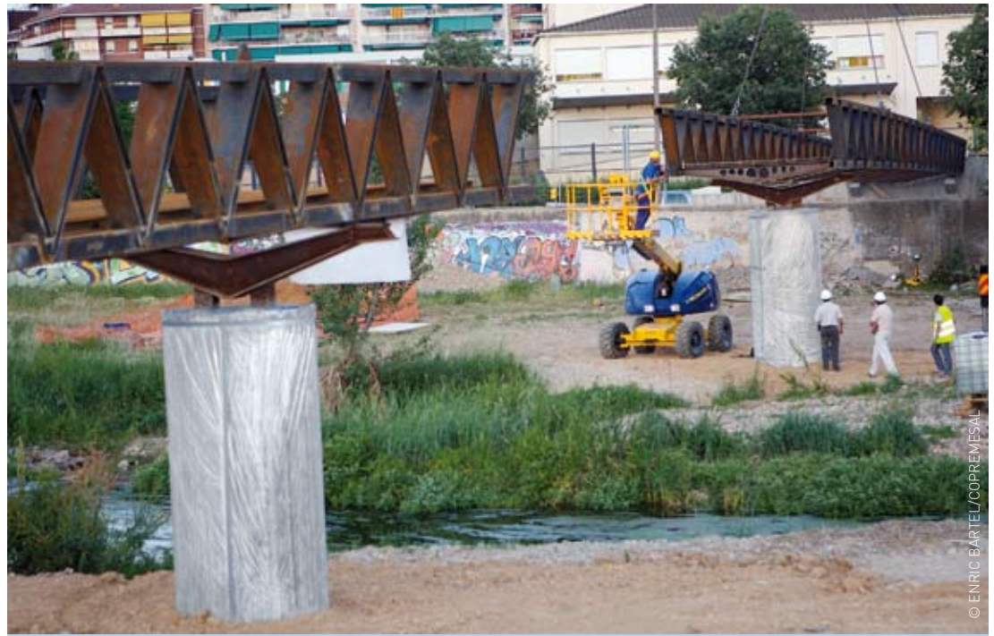
25 metres és la distància que falta per tenir l'estructura de la passera completa

L'Ajuntament de Granollers aposta per una nova fórmula per aconseguir una mobilitat més sostenible a la ciutat, el sistema de lloguer de cotxes per hores. A partir d'aquest estiu Granollers disposarà de quatre cotxes que estaran estacionats als aparcaments El Sot i Sant Carles. El sistema de lloguer de cotxes per hores permet estalviar les despeses de manteniment i serveix perquè diversos usuaris puguin utilitzar un mateix vehicle estacionat en un pàrquing proper només pagant una quota d'alta d'associat i les tarifes que corresponguin al temps d'utilització i als quilòmetres recorreguts. Un servei que té diferents avantatges: flexibilitat: el cotxe que vols quan vols; economia: la disponibilitat d'un cotxe sense preocupar-se de les reparacions, assegurances; i sostenibilitat: disminució del nombre de cotxes al carrer; una combinació intel·ligent i còmode amb el transport públic. Per a més informació podeu consultar www.avancar.es/cat/aj_granollers.asp