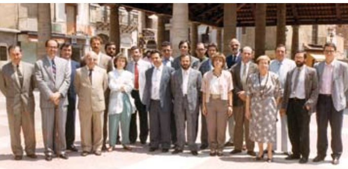
Diferents moments de l'activitat política de Josep Mayoral