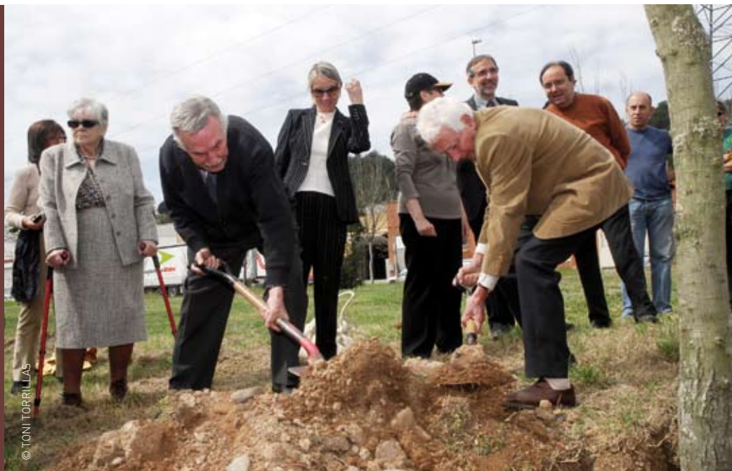
Membres de la comissió cívica del 70è. aniversari del bombardeig plantant els primers arbres del Bosc de la Pau

Conferències, exposicions, visites guiades, concerts, activitats a les biblioteques... Són només algunes de la trentena de propostes que conformen el programa que commemora el 70è. aniversari del bombardeig de Granollers de 1938. El gruix de la programació, que podeu consultar en aquest mateix butlletí, s'inicia un cop acabada l'Ascensió i donarà a conèixer o recordar un tràgic esdeveniment que va marcar la història de Granollers. Una ciutat que, amb el referent d'aquesta experiència, està treballant el valor de la pau des de diverses perspectives.