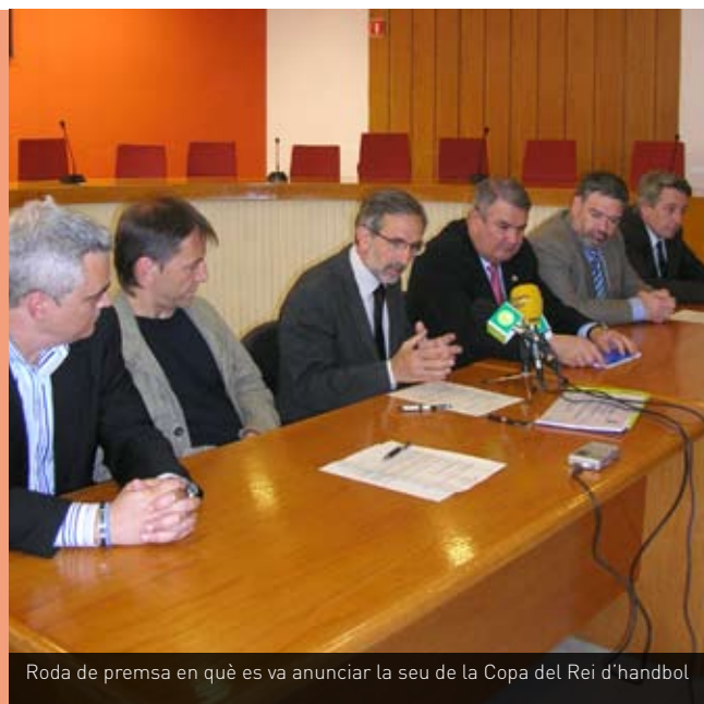
Roda de premsa en què es va anunciar la seu de la Copa del Rei d'handbol