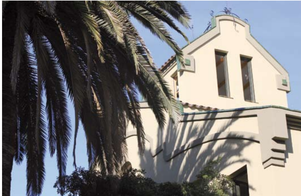
L'edifici que acollirà el Centre de Cultura per la Pau, al carrer del Rec

Podem completar la informació sobre el bombardeig amb la visita a l'exposició GR.31/5/1938, que s'inaugura el 30 de maig al Museu de Granollers. Es