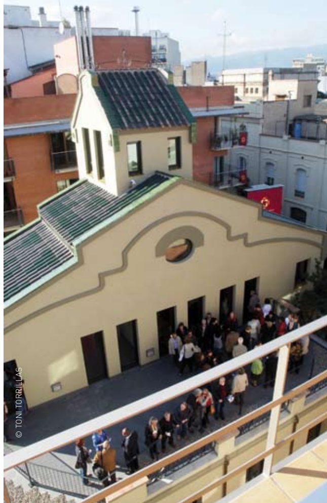
La inauguració de Can Jonch. Centre de Cultura per la Pau va despertar l'expectació de la ciutadania