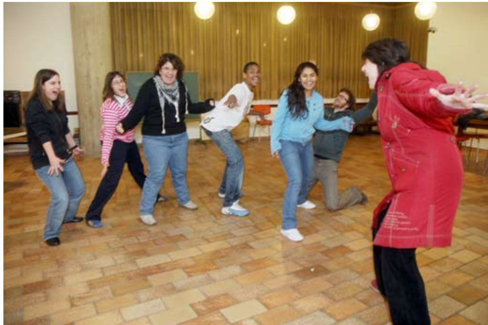
El grup de teatre social en un dels seus últims assajos