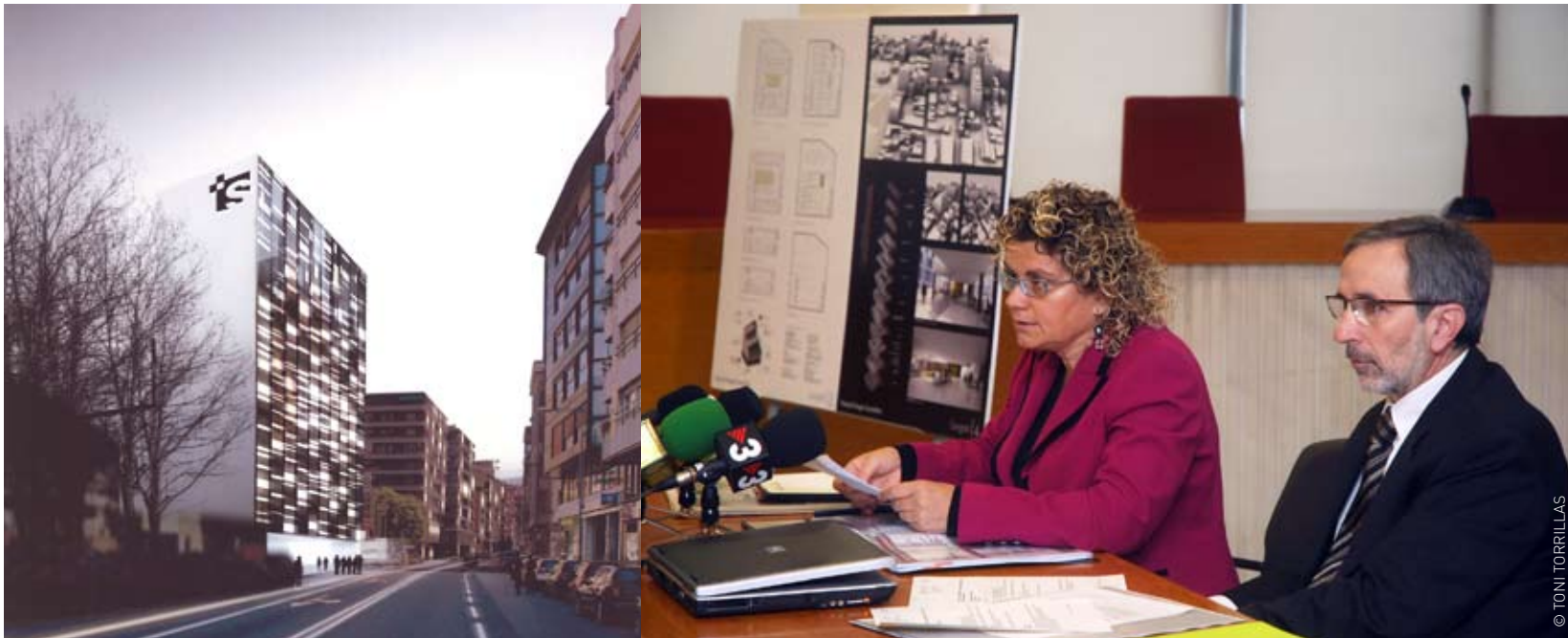
Imatge virtual del futur edifici de l'hospital lleuger

Serà un equipament d'alta capacitat resolutiva