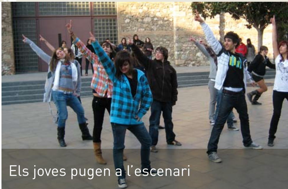
Els joves pugen a l'escenari

20.45 h Plaça de la Porxada Inici del IV Taller de Sardanes