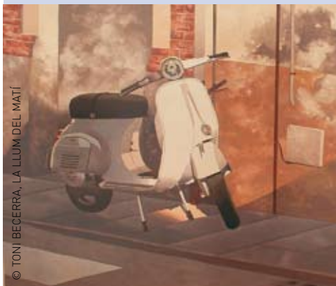
© TONI BECERRA, LA LLUM DEL MATÍ