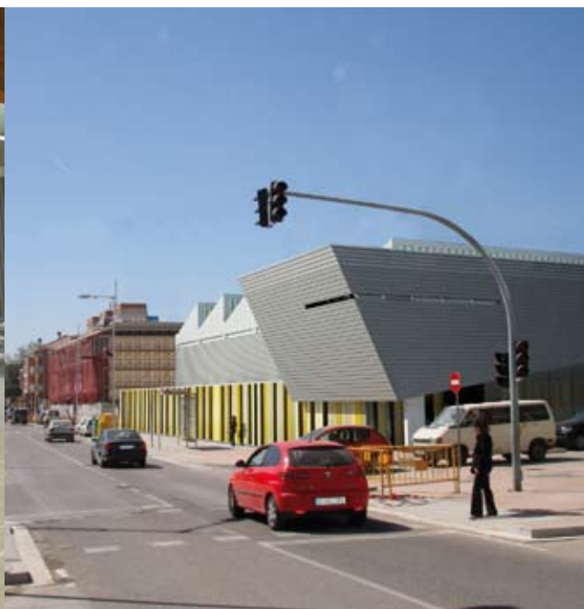
Imatges virtuals del nou pavelló del Congost

El barri Congost tindrà una nova instal·lació esportiva, que es situarà en el mateix emplaçament on actualment hi ha l'antic pavelló, d'estructura lleugera i tancament de lona.