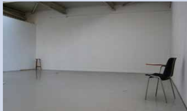
Sala Miró - Anibal Parada

2 per Granollers, fotografies de Sam Banon i Quico Comas Del 16 de desembre de 2009 al 9 de gener de 2010 Inaug.: dia 16, a les 20 h