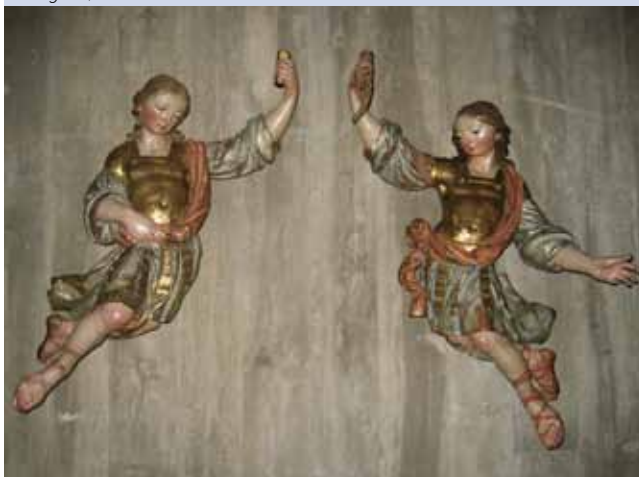
Àngels, escultura barroca del fons del museu

EL BALCÓ Cap de Medusa. Fragment arquitectònic de marbre blanc, s II dC Fins al 13 de desembre