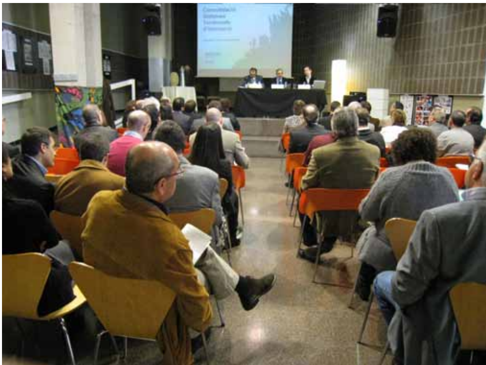
Presentació del Pla d'Innovació Local a Granollers

El Vallès Oriental es caracteritza en els negocis d'alimentació, hàbitat i salut. Aquesta és la conclusió que es desprèn del Pla d'innovació del Vallès Oriental, coliderat per ACCIÓ, l'Ajuntament de Granollers i el Consell Comarcal del Vallès Oriental, i que té l'objectiu de dinamitzar el teixit econòmic de la comarca. El Pla identifica els eixos que han d'actuar com a transformadors de la realitat econòmica del territori i preveu dur a terme actuacions per reforçar els clústers amb major potencial de creixement identificats a la comarca: alimentació, hàbitat i salut.