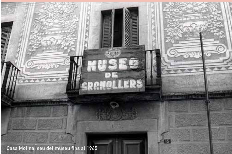
Casa Molina, seu del museu fins al 1965

Més informació, a l'agendai a www.museugranollers.org