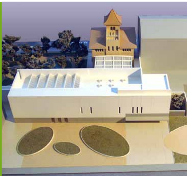
Maqueta de l'ampliació del Museu de Ciències Naturals La Tela

En la mateixa línia que l'any passat, l'Ajuntament de Granollers encara el 2010 amb un pressupost que conté una destacada inversió per tal d'incentivar l'activitat econòmica d'un any que encara es preveu difícil. Seran 27 milions d'inversió municipal als quals s'hi sumaran 5 més procedents dels Fons Estatsals per a l'Ocupació i la Sostenibilitat Local. El pressupost, de 99,7 milions d'euros, acusa també la situació econòmica ja que comptarà amb menys ingressos procedents de tributs i del govern de l'Estat. No obstant, la despesa social augmentarà un 7 % mentre que la despesa corrent que apliquen els diferents serveis municipals es reduirà globalment un 2 %