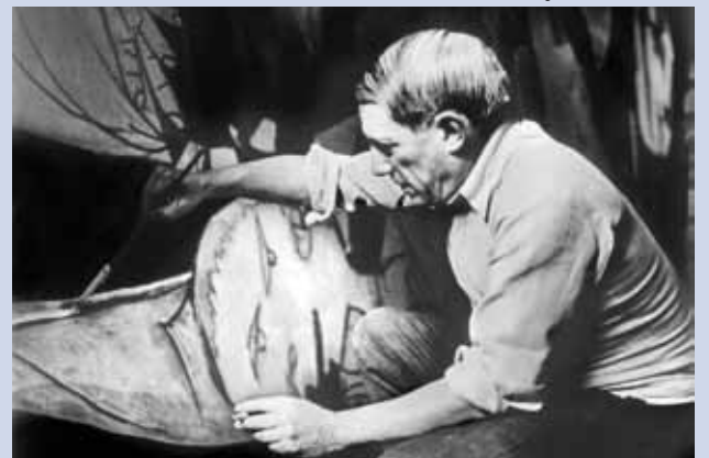
Dora Maar, Picasso treballant en el Guernica al taller de Grands-Agustins, 1937, París

L'ADOBERIA. Centre d'interpretació històrica del Granollers medieval Apunts de Granollers. Dibuixos d'Ermengol Vinaixa i Gaig