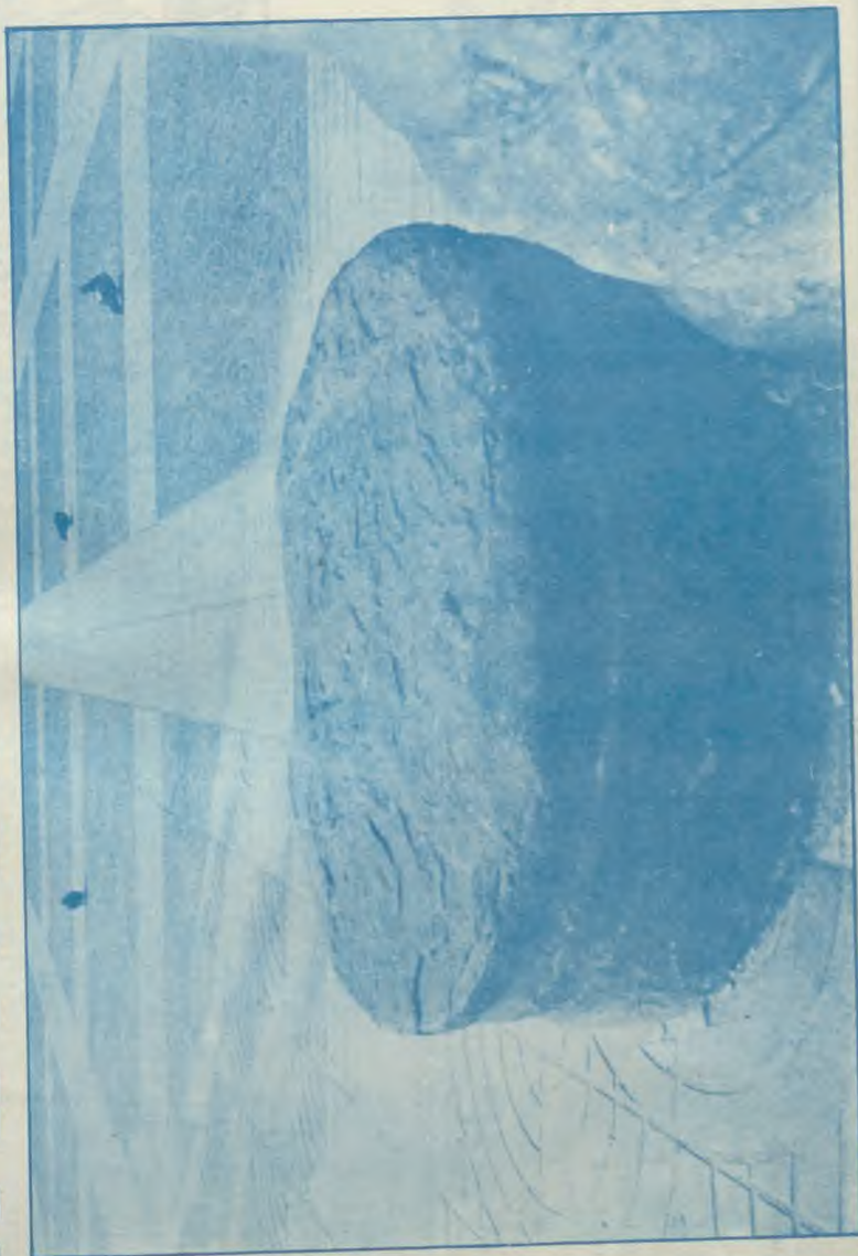
PEDRA DE L'ENCANT — LA PORXADA — GRANOLLERS