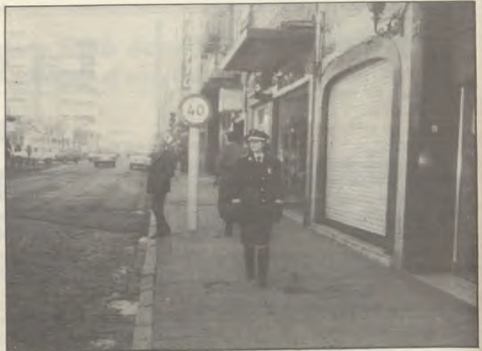
Una nueva silueta en las calles de la ciudad.