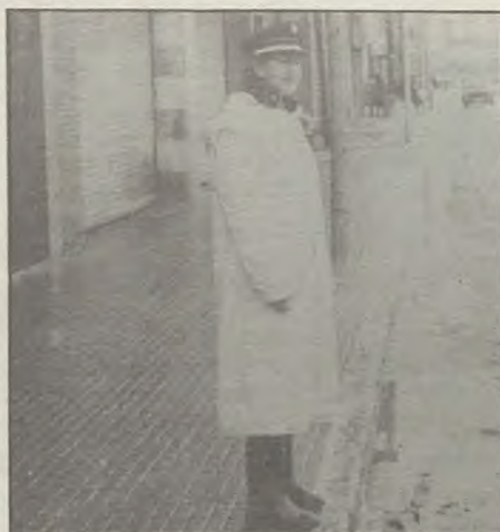
Se estrenaron con lluvia.

En la actualidad la Guardia Urbana cuenta con una plantilla de 60 miembros. El último aumento de plantilla, consignado hace unas semanas, supuso la incorporación de trece nuevos agentes, cinco mujeres y ocho hombres.