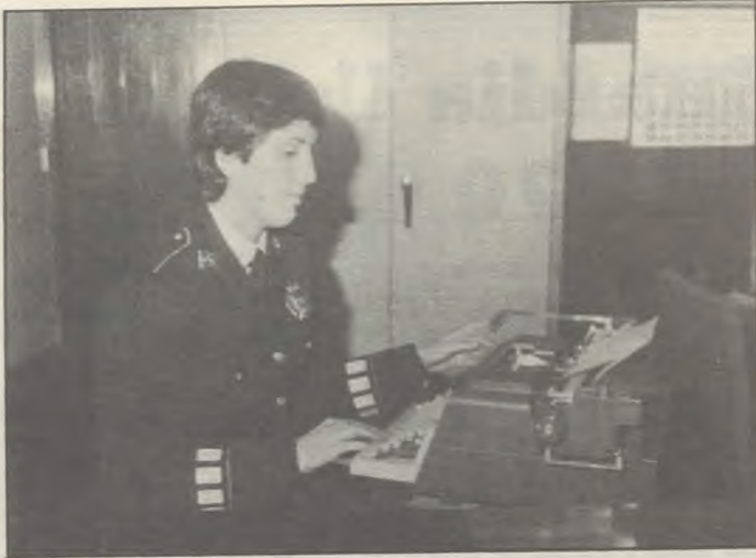
Hay que atender también a la oficina.