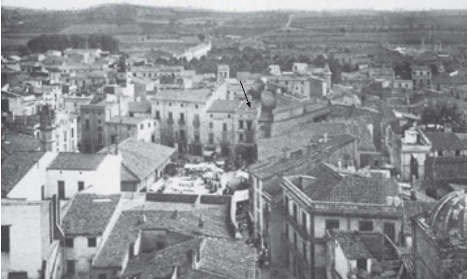
A dalt: Vista de la plaça de la Porxada des del campanar de l'església de Sant Esteve. S'hi assenyala la casa d'Esteve Garrell A baix: Fragment de la portada del periòdic El Congost , que editava Esteve Garrell. Correspon al dia 17 de gener de 1895 i recorda les víctimes de l'assalt dels carlins a Granollers del 17 de gener de 1875