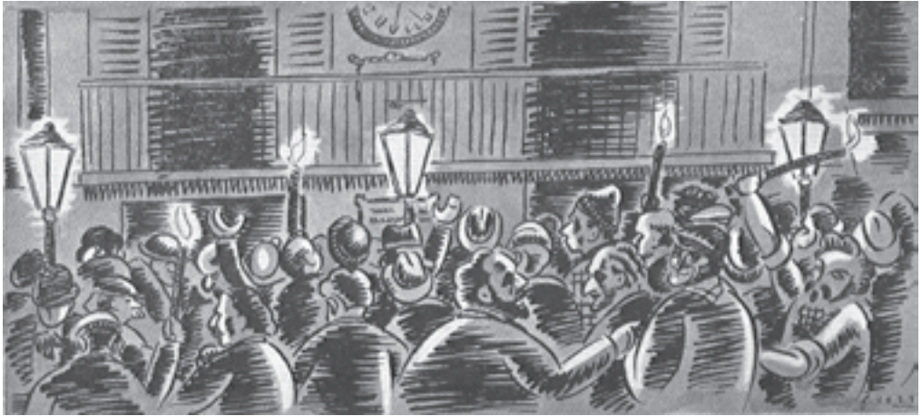
A dalt: Manifestació de protesta de la nit del 2 d'abril de 1887, que donà lloc a la creació de la Unió Liberal, segons un dibuix de Francesc Serra (Font: Publicacions La Gralla , 1930, vol. IV: «La vida de la societats locals». HMG) A baix: façana exterior i teatre de la Unió Liberal, cap al final del segle XIX (Fotografies: HMG)