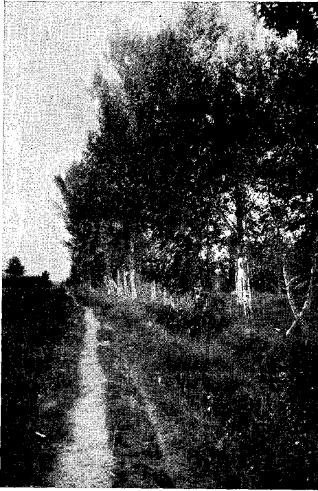
VALLÈS ARTÍSTIC. — Camí de Canovelles.