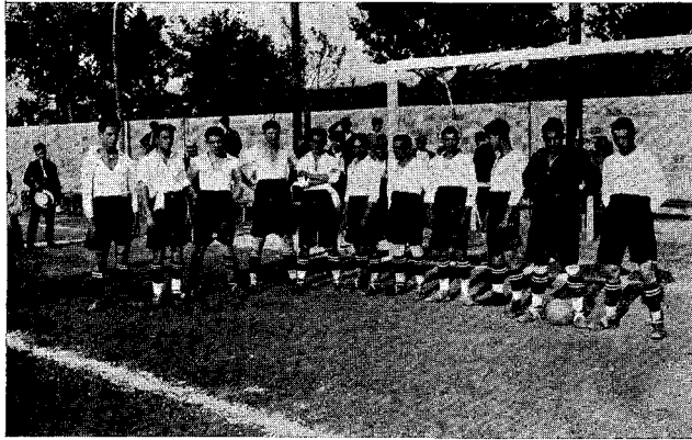
Primer equip del "Granollers S. C." que vencé al reserva del "Barcelona".