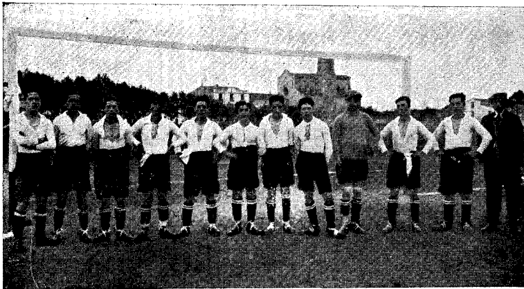
Els "Ràpids", de Granollers, que lluiten amb fè esperant una victòria...