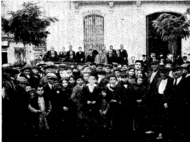
MOLLET. — Diada Nacionalista amb motiu de la inauguració d'un Centre.