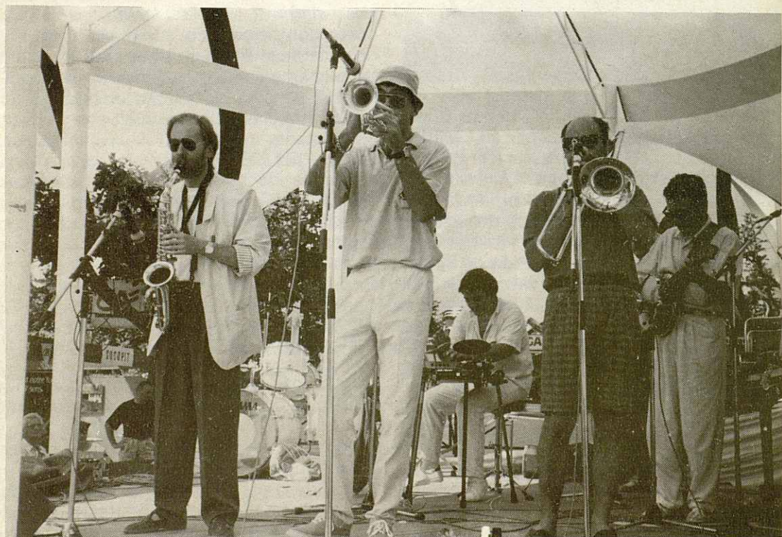
TING A LING, Grup oficial de Marciac, al pòdium de la plaça. (14 d'agost 1989)

ORIGINAL PRAGUE SYNCOPATED ORCHESTRA (Checoslovacos). Una gran orquesta de 16 integrantes, más 3 cantantes. Jazz de corte, o estilo años 25 de los salones blancos de la época. Junto con