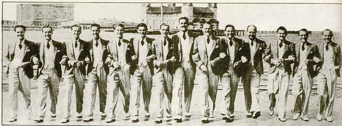
La Casa Loma Orchestra, que inicien el pre-swing