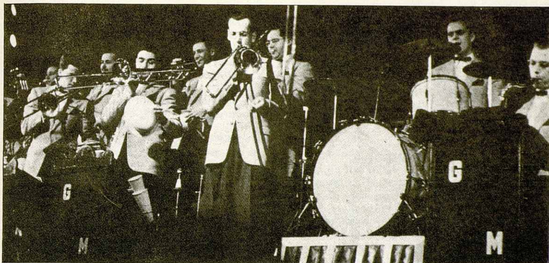
Glenn Miller, a l'acabament de l'època d'aurada

trionfat a Nord-Amèrica i que és el producte de consum musical per excel·lència, triomfa també arreu del món. Ràpidament, totes les orquestres imiten tant com poden aquestes orquestres americanes que estan al cim de la popularitat. Els professionals de la música resten bocabadats davant la perfecció formal dels arranjaments de l'orquestra de Glenn Miller, per exemple, interpretats amb un gust refinat per un personal de gran formació tècnica i amb unes gravacions increïbles de perfecció (entre parèntesi: en aquest mateix temps, a Barcelona, es graven uns discos infames, que fan caure la cara de vergonya).