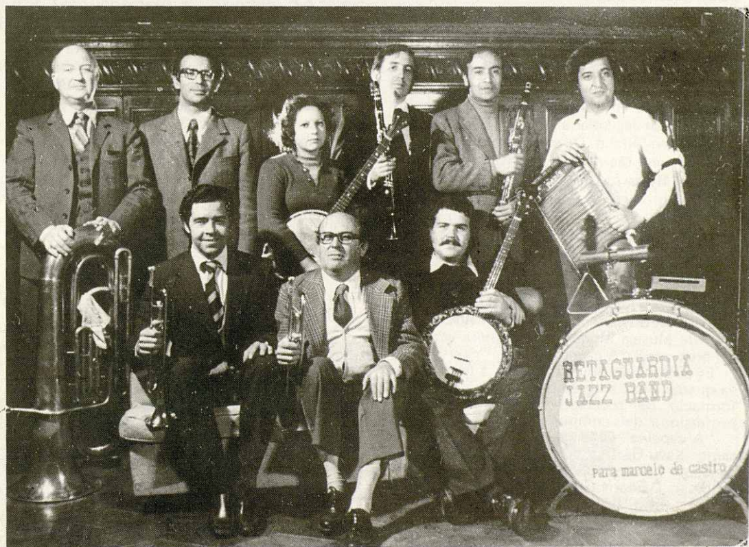
RETAGUARDIA JAZZ BAND - 1972

Curioso es reseñar también la calidad y el interés de los músicos de Jazz de Chile y de su educación en el Jazz sin fronteras y sin críticas negativas de estilos entre ellos, y como dato ilustrativo señalaremos a continuación los modelos de agrupaciones que hoy día per-