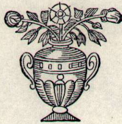
Lletra i música d'autors desconeguts.

AL QUAL, EN EL SANTUARI COM FILL LA PARROQUIA DE