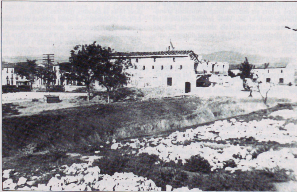
AHIR: Hospital Vell al final del Carrer Caputxins

Desitgem, superar-nos cada any, no tant sols en la formació artística, sinó per la figura del nostre amic i homenatjat que bé s'ho mereix; i pel prestigi de la nostra centenària Societat. Desitgem aconseguir-ho!. Aquesta II Memorial de Fotografia hem acordat titular-lo "Granollers, de VILA A CIUTAT", tot presentant reproduccions de fotos, postals de fa més de 50