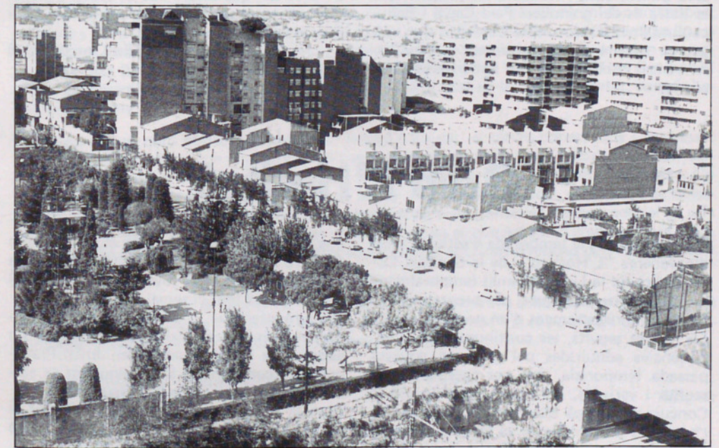
AVUI: Servei Metereològic al final del Carrer Vinyamata