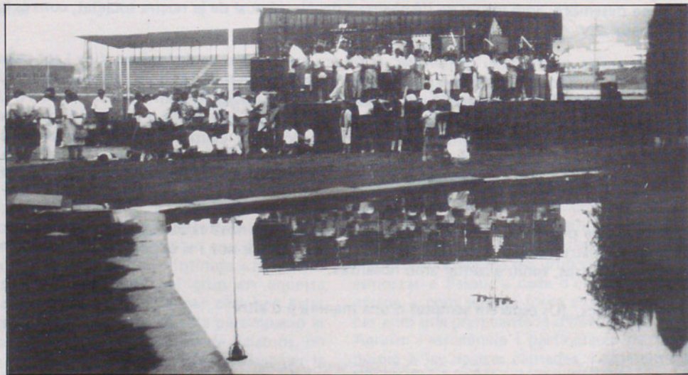
Preparatius de la Trobada de Cors de Clavé del Vallès de l'estiu passat

Esperem que el jovent que li agradi cantar entri en aquest intent musical juvenil, la seva inscripció podeu fer a la Secretaria, de 6 a 8 de la tarda, de dimarts a dissabte.