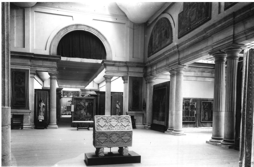
Sales del Museu d'Art de la Ciutadella l'any 1921. Al fons de la sala central, a ambdós costats de l'arc, les taules dels profetes Isaïes (esquerra) i Moisès (dreta). A la sala de la dreta es veu la taula de l'Ordenació de sant Esteve al diaconat i el retaul de sant Sebastià i sant Eloi.