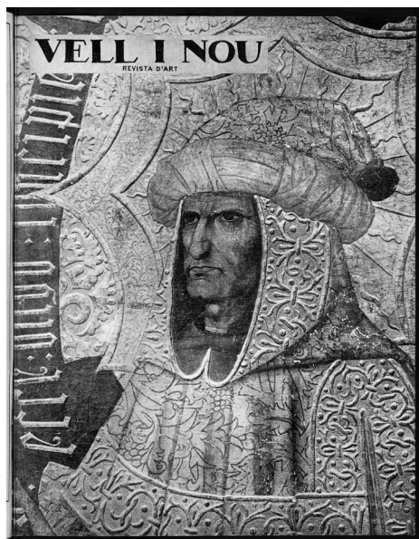
Portada de Vell i Nou . Revista Quinzenal d'Art. Any I, núm. 7, 15 agost 1915, amb un detall de la taula del profeta Isaïes. En aquesta edició de la revista es publicà un documentat estudi del retaule gòtic de Sant Esteve de Granollers, a càrrec de Salvador Sanpere i Miquel.

Ponències Revista del Centre d'Estudis de Granollers, 25 (2021), 129-149