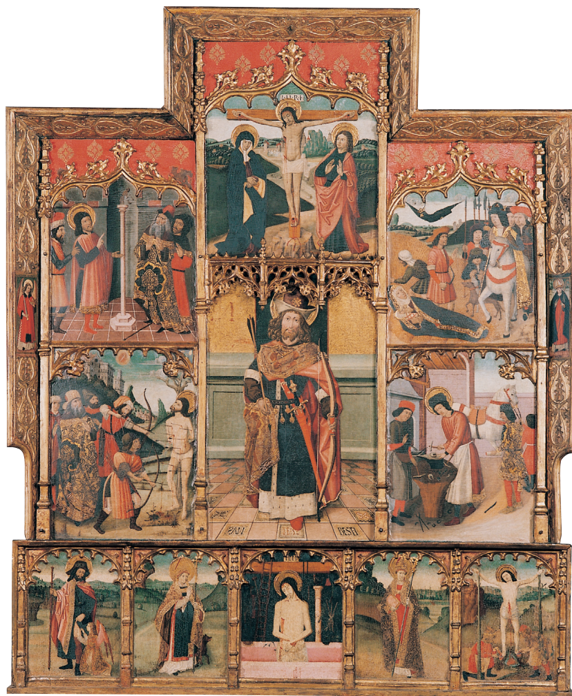
Retaul de sant Sebastià i sant Eloi, que fins al 1879 ocupava una capella lateral de l'església de Sant Esteve de Granollers, i que va ser venut juntament amb el retaul de sant Esteve.

Sancto, segons diuen els textos públics, y algunes de les quals sorprén no trovar en el de Granollers, com també faltan plafons del bancal. 46 Donat el desenvolup de l'absis de l'iglesia parroquial de Granollers, quedaria un retaul migrat, sols amb les pintures existents. Les dels Profetes estaven potser