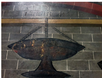
La princesa Eudòxia davant la tomba de Sant Esteve i detall amb la inscripció «Jauma homs».