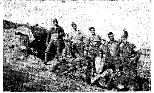
Milicians a la barberia