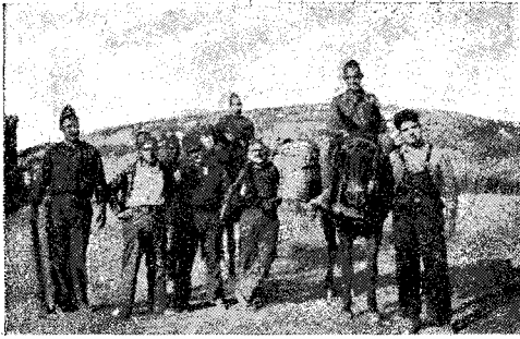
La caravana dels cuiners