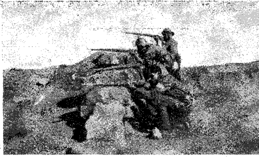
Una posició dels nostres