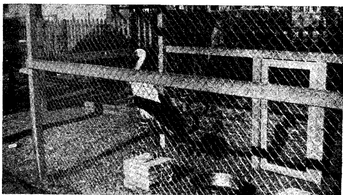
La cigonya que s'avorreix al Parc.

No vull encaminar aquest reportatge a la crítica del film del mateix nom. La primavera ha arribat una mica tard, per a poder-ne lloar els seus encants. No obstant, aquests diumenges fa bo de pas-