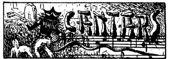
Obligats de Clar-i-net.

¿Que vens, van preguntá'l Frarc , á L'Unió á sentí'l concert? No, primer vull enterarme si es que obliga'l «Clar-i-net».