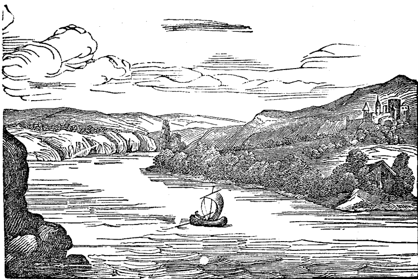
Riberas del Ebro, d' un croquis de V. M.