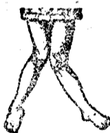
Desviacion de la rodilla y el pié 3.º grado.

Con este aparato se puede obtener una curacion radical de las hernias recientes y alivio y detencion de las crónicas. Mis aparatos ortopédicos no dejan nada que desear, pues siendo fabricados en mi casa, puedo darlos á precios muy ventajosos y en las mejores condiciones de elegancia y solidez posible. Se garantiza la eficacia de todos los aparatos que salen de mi establecimiento. Recomendados por los mejores facultativos.