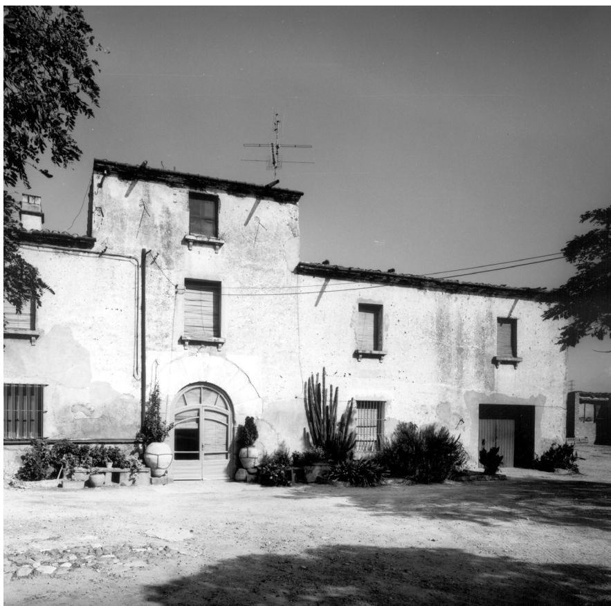
Masia de Can Plantada