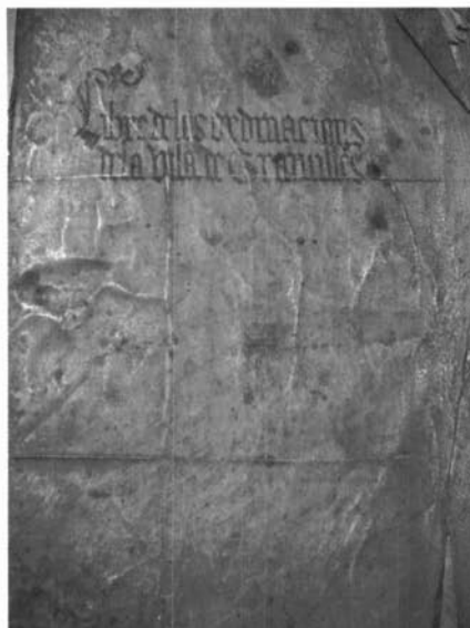
Portada del Llibre d'ordinacions de la vila de Granollers, segle XV . (Hemeroteca Municipal Josep Móra de Granollers)

«Ordinació sobre lo quarta de gra». Llibre d'ordinacions de la vila de Granollers, segle XV . (Hemeroteca Municipal Josep Móra de Granollers)