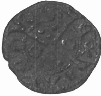
Croat de plata del casal d'Olivet, Canovelles.

quines proporcions? D'algunes viles tenim llistes de veïns dels segles XIV-XVI, amb les seves professions. Tot i que la composició socioprofessional d'aquelles aglomeracions depenia de molts factors, es pot dir que hi havia gent del ram tèxtil (paraires, teixidors, sastres, abaixadors), de l'alimentari i derivats (flequers, hostalers, taverners, carnisers, moliners, apotecaris, boters, ollers), de la indústria del metall (ferrers, daguers), de la indústria del cuir (sabaters, basters, blanquers), de la construcció (fusters, mestres de cases), del comerç i el transport (traginers, mercaders, revenedors, missatgers), homes de lleis (notaris), clergues i un cert nombre de pagesos.