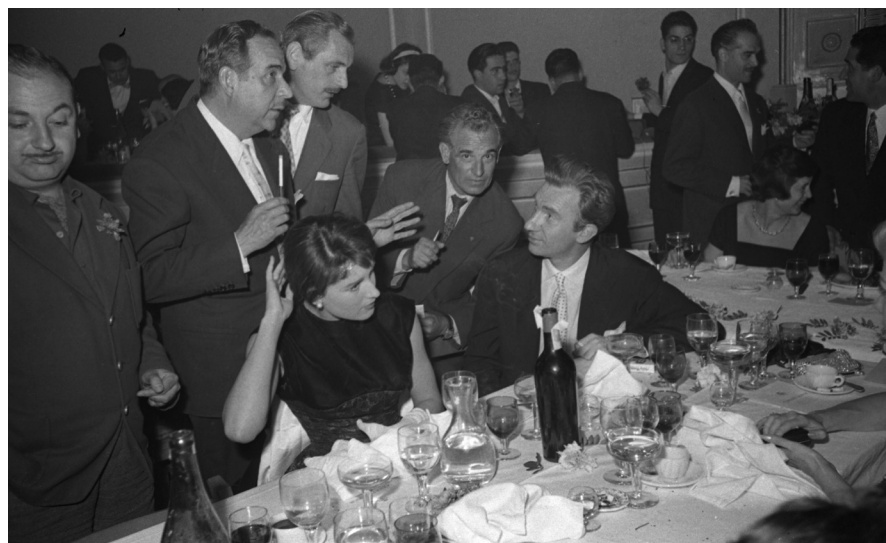
L'any 1957 va tenir lloc a Granollers la I Setmana del Cinema Espanyol. Durant els quatre dies de la Fira de l'Ascensió, entre el 30 de maig i el 2 de juny, es van projectar diverses pel·lícules als cinemes Mundial i Coliseum, i es va comptar amb la presència d'alguns dels actors i actrius més destacats del moment. A la fotografia, l'actriu Analia Gadé i l'actor Fernando Fernán Gómez, al sopar d'homenatge celebrat al Casino de Granollers.