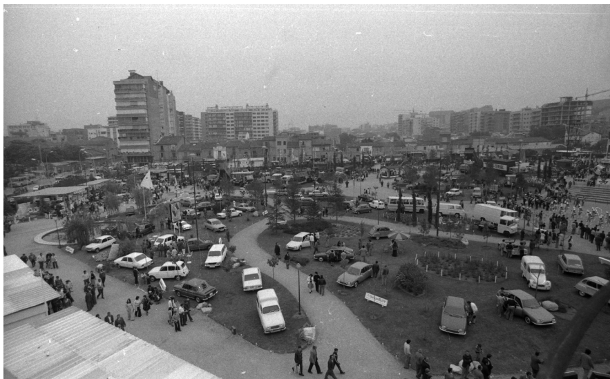
Durant els anys 1970 el Parc Torras Villà acollí bona part del recinte firal, en el qual s'oferien les últimes novetats del mercat de vehicle i maquinària agrícola. A la imatge, una vista panoràmica del parc de maig de 1975.