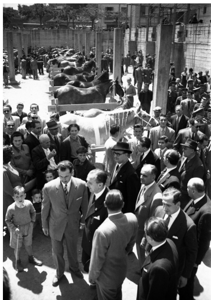
El ministre d'Agricultura, Carlos Rein, durant la visita a la mostra de cavalls, en l'espai que havia d'ocupar el primer projecte de construcció del mercat municipal, a la plaça de Pau Casals, el 6 de maig de 1948.