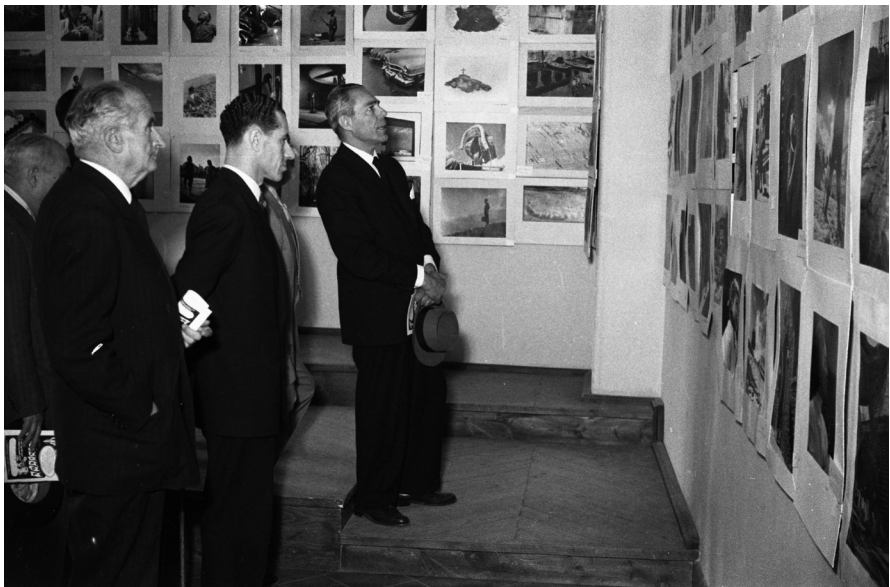
Visita de les autoritats al II Concurs de fotografia artística, a la sala d'actes de la Caixa d'Estalvis Provincial de Barcelona, durant la fira de 1955.