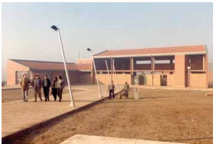
Construcció del centre cívic Can Bassa, anys 80.

El 1983 va arribar un pla de millores urbanístiques que preveia, entre altres accions, la construcció de les pistes poliesportives de l'escola Celestí Bellera. El 1986 s'inaugura la plaça de Joan Oliver i el centre cívic Can Bassa, que a més de serveis culturals, com la sala de lectura o la de trobada per a la gent gran, disposava d'una sala d'assistència mèdica.