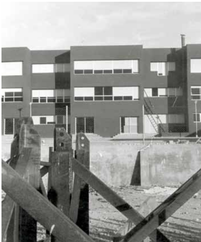
Façana de l'escola Celestí Bellera, 1974.

L'escola Celestí Bellera s'inaugura el 1975, coincidint amb l'inici del barri i sent, així, el primer servei que s'oferia. Des d'aquell any, funciona com a centre d'educació primària i a causa de la gran demanda d'alumnes amb necessitats d'escolarització, es decideix crear l'escola Mestres Montaña. A partir de llavors, l'any 1986, el Celestí Bellera esdevé un centre de secundària i passa el relleu a la nova escola.