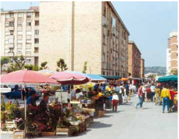
Mercat al camí de Can Bassa, 1990.

“Hi va haver un temps en què el mercat es feia a la plaça de Joan Oliver, però, com que hi havia terra, era molt brut i el van canviar a la zona del Celestí Bellera.” P. Zueras