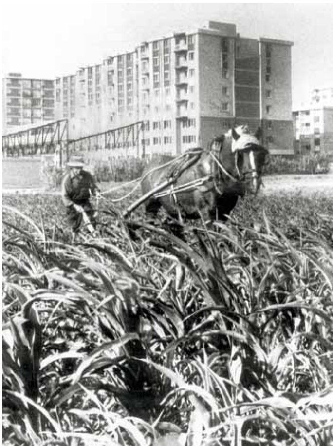
Treballant els camps de Can Bassa, 1974.

“No hi havia el que hi ha ara, era els quatre blocs d'aquí, la plaça i cases de pagès.” J. Valero