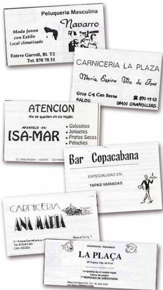
Publicitat dels comerços de Can Bassa entre 1993 i 1994. Revista de Can Bassa

Paral·lelament a la construcció dels blocs de pisos, es van crear 31 locals per a comerços. Aquests comerços eren principalment autònoms, pertanyien a persones que vivien al barri. Així, els habitants de Can Bassa no tenien l'obligació de desplaçar-se per adquirir productes de primera necessitat.