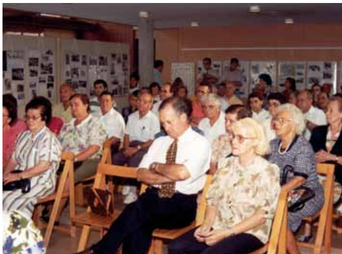
Presentació d'una exposició al centre cívic Can Bassa, 1993.

“Amb el centre cívic, es volia donar servei tant als avis com a l'esplai, com donar servei a través d'una sala de lectura i que els joves ho poguessin utilitzar.” J. C. Cusell