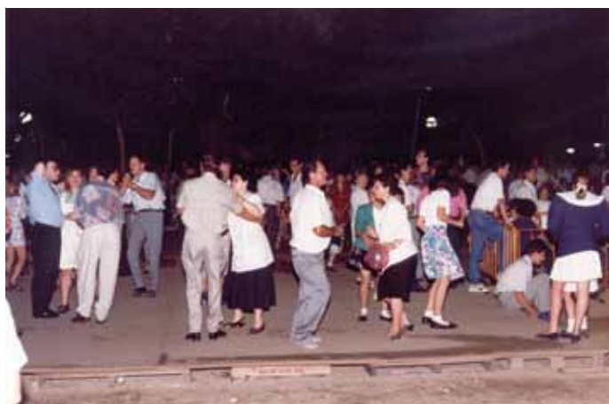
Veïns i veïnes del barri a les festes de Can Bassa, 1991.

“En Sant Joan siempre han hecho muchas cosas, entablado, espuma, merienda, chocolate... eran unas fiestas muy extensas. Y hoy lo siguen siendo.”