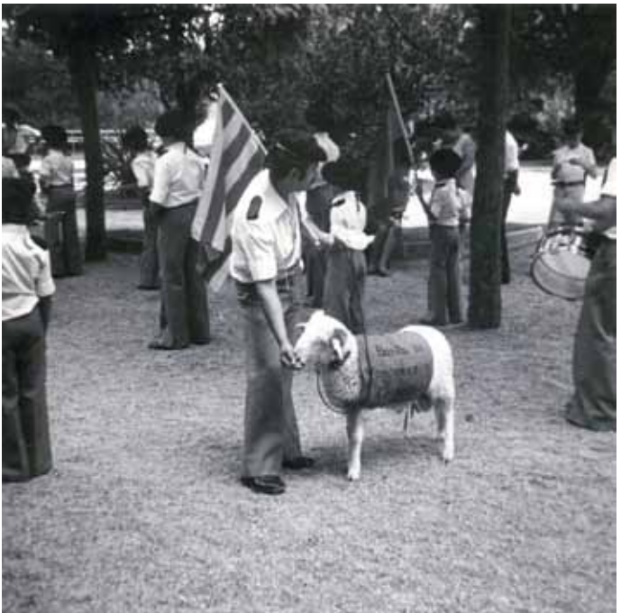
Sortida de la Banda de Tambors i Cornetes de Can Bassa a Centelles, per la festa major, finals dels anys 70.

Un fet molt important del barri era que tenia l'única Banda de Tambors i Majorets de Granollers, creada el 1978. Participava en diferents actes i festes, fent exhibicions. També es trobaven, participant en activitats de la programació del centre cívic, a partir del 1986, un grup de joves i un altre de dones.