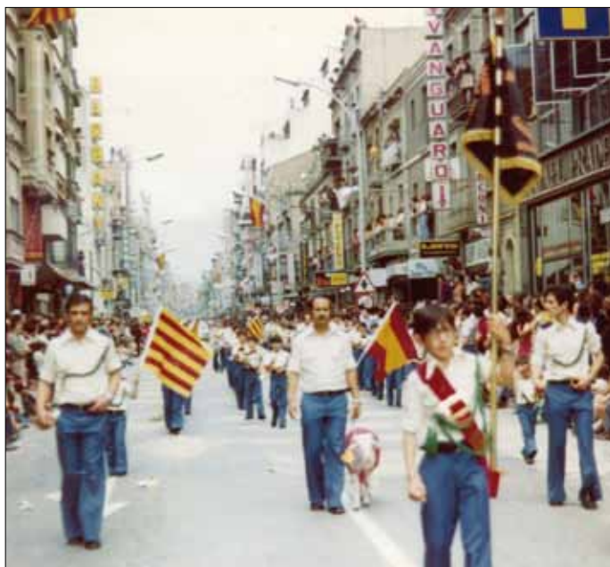
Desfilada al centre de Granollers de la Banda de Tambors i Cornetes de Can Bassa, el 6 de juliol de 1975.

“Los chicos y chicas de la banda estaban muy contentos, porque salían a otros pueblos a tocar, y los padres iban con los niños.” L. Ramos