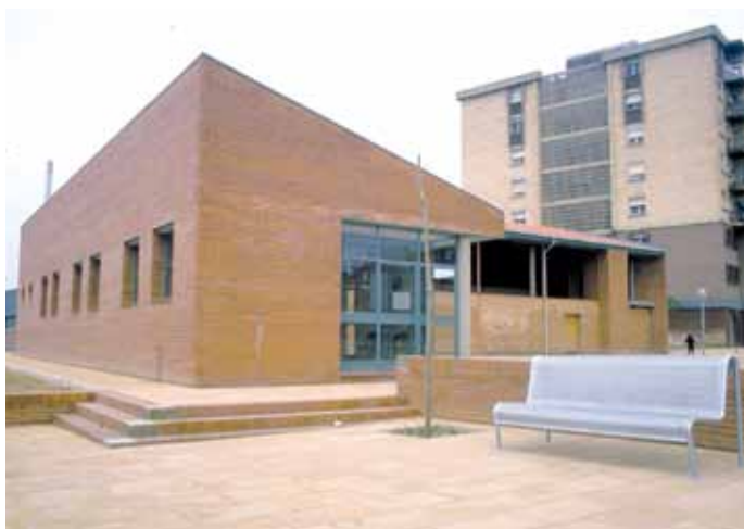
Dispensari mèdic del centre cívic Can Bassa, 1980 - 1986.

El 1982 es comença a parlar de la construcció d'un nou ambulatori, que es faria realitat uns anys després i que ara ja no existeix. El mateix any, comença a funcionar un servei mèdic provisional destinat a donar injeccions de manera gratuïta, on cada usuari s'havia de portar la xeringa, el medicament i la recepta del metge. Disposaven d'un servei mèdic en què es visitava dos cops per setmana, per evitar el desplaçament a la ciutat als ciutadans amb més dificultats.