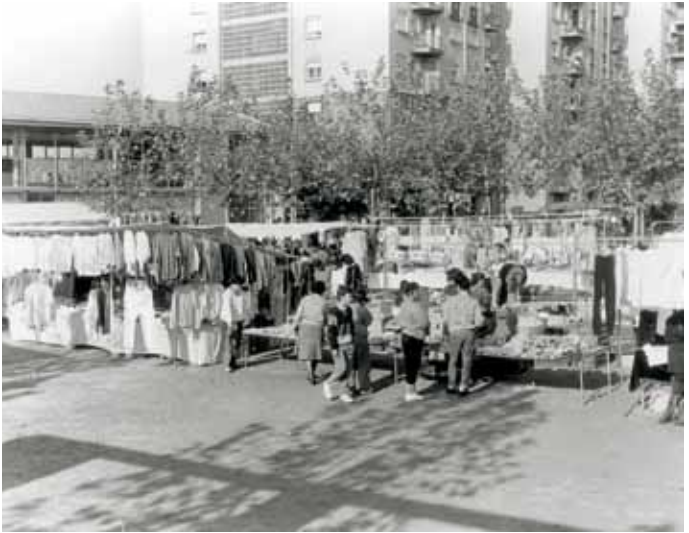
Mercat a la plaça de Joan Oliver, 1990.

A finals de l'any 1989, es crea el mercat del barri, que al principi tenia unes cinquanta parades.