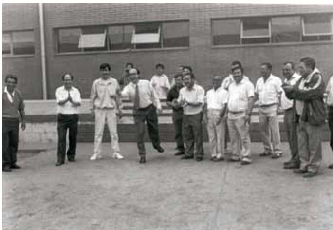
Club de Petanca del barri de Can Bassa, anys 90.

Pel que fa a l'esport, una altra entitat destacable del barri va ser la Unió Esportiva de Palou, formada per jugadors de l'equip de Palou, que majoritàriament vivien a Can Bassa. Aquesta entitat s'encarregava d'aspectes futbolístics i funcionava com una penya. També s'organitzaven partits de petanca: es va crear un equip d'aquesta modalitat i es va participar en la primera lliga al 1981.