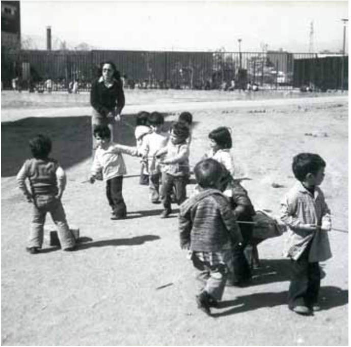
Sortida de l'escola bressol La Tortuga, al costat del Celestí Bellera, al febrer-març del curs 1980 - 1981.

L'escola bressol La Tortuga inicia la seva activitat el curs 1977-78 a conseqüència de la lluita del veïnat, a través de l'associació de veïns, que reivindicava nous serveis al barri. Malgrat les dificultats econòmiques viscudes als inicis, La Tortuga va funcionar, i va anar millorant i creixent amb el pas del temps. Des de sempre s'ha treballat la sociabilitat, l'educació, els hàbits i les habilitats psicomotrius de l'infant, a través de vivències i sensacions, per millorar l'assimilació del coneixement i afavorir l'aprenentatge. Un dels elements destacables de l'escola és l'organització per racons. Per tal que el nen descobrís l'entorn de primera mà, les sortides i excursions a la natura estaven a l'ordre del dia, cosa que afavoria el procés d'aprenentatge.