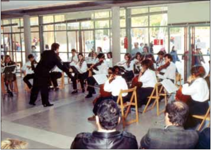
Actuació de l'orquestra juvenil de l'Escola Municipal de Música Josep M. Ruera al centre cívic Can Bassa, 1986-1992.