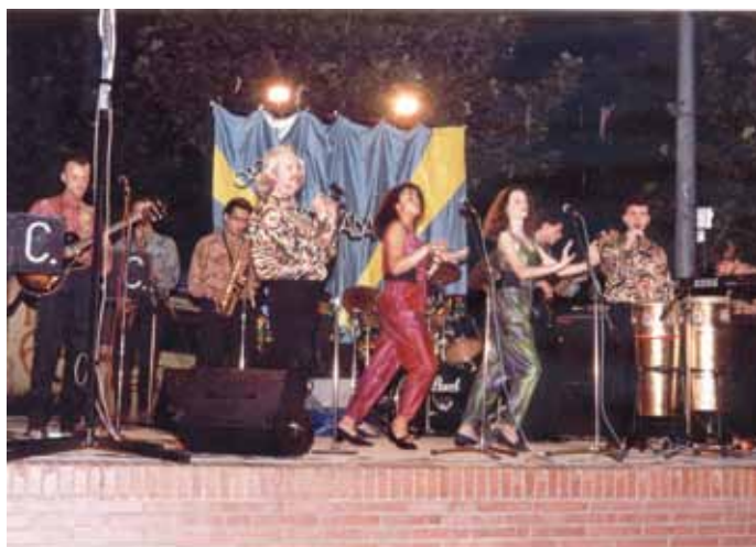
Actuació a les festes del barri de Can Bassa, 1991.