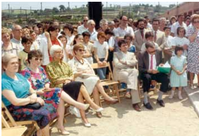
Homenatge als mestres Montaña, maig de 1986.

“Éste es mi barrio, lo hace especial que nos conocemos todo el mundo [...] Yo lo veo perfecto, no le falta nada.” M. Martin