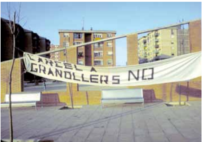
Protesta en contra de la presó de Quatre Camins a la plaça de Can Bassa, anys 80.

A finals de 1983, es decideix construir la presó de Quatre Camins. L'Associació de Veïns de Can Bassa acorda crear, juntament amb associacions de Palou i Sant Miquel, una comissió antipresó. Es reuneixen per parlar de com evitar-ne la construcció, ja que es creu que el projecte afectarà negativament els barris propers a la presó, al Centre Montserrat Montero i a tot Granollers en general. Finalment, la presó es va inaugurar el juliol de 1989.