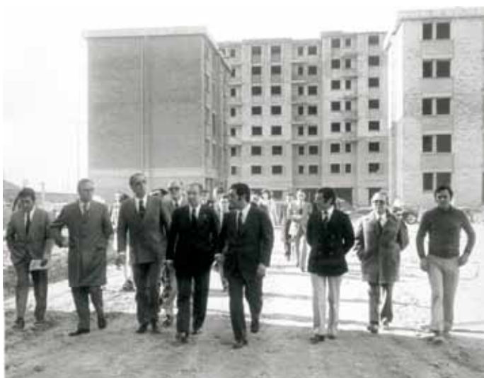
Inauguració de pisos a Can Bassa, 1974.

“Cuando llegué, no había agua ni luz, durante tres meses.” C. Ureña