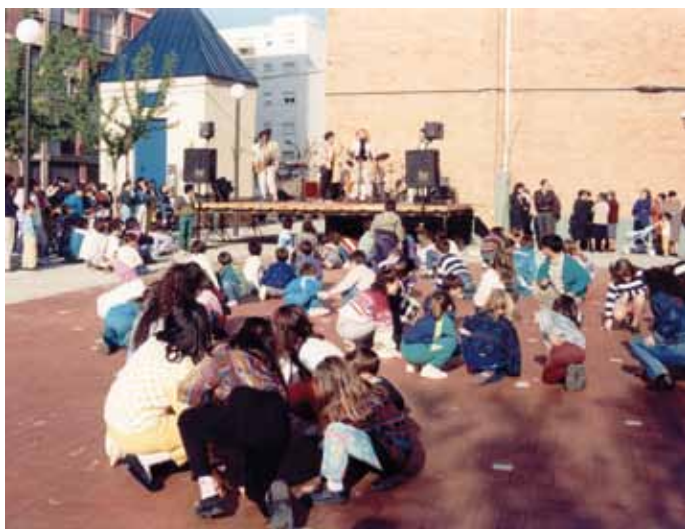
Festa infantil del barri de Can Bassa, anys 90.

“Abans la gent sortia al carrer cada dia a prendre la fresca, uns amb la cadireta, altres als bancs... a la plaça de Can Bassa. La relació entre els veïns era molt bona. Encara hi ha gent que ho fa.” P. Zueras