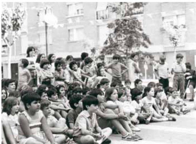
Festes de Sant Joan, juny de 1983.

Al barri també van arribar famílies amb nens, que van començar a fer pinya i a partir d'aquella unió es va decidir formar, entre uns quants joves, el Casal Jove.