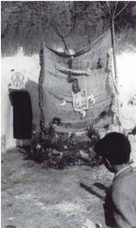
1952.