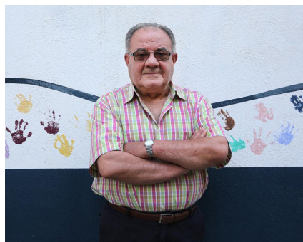
Retrat de Pere Fortuny.