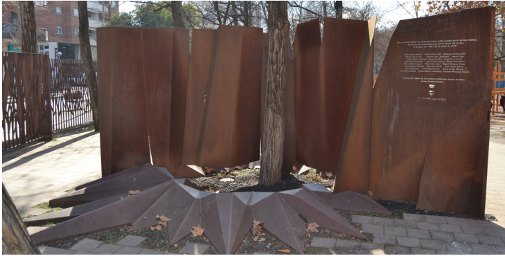
Monument a les víctimes dels bombardeigs de 1938 i 1939 a Mollet del Vallès.

Els resultats de l'enquesta van indicar un coneixement mitjà o baix dels fets que es van produir a Mollet en el temps de la Guerra Civil i el franquisme, molt especialment en el cas de la població més jove. Al mateix temps, però, també evidenciaven la receptivitat dels enquestats a conèixer més sobre la història de la seva ciutat. És per això que la pregunta que toca fer-se ara és com podem fer arribar aquesta història de manera senzilla i accessible a la nostra ciutadania.