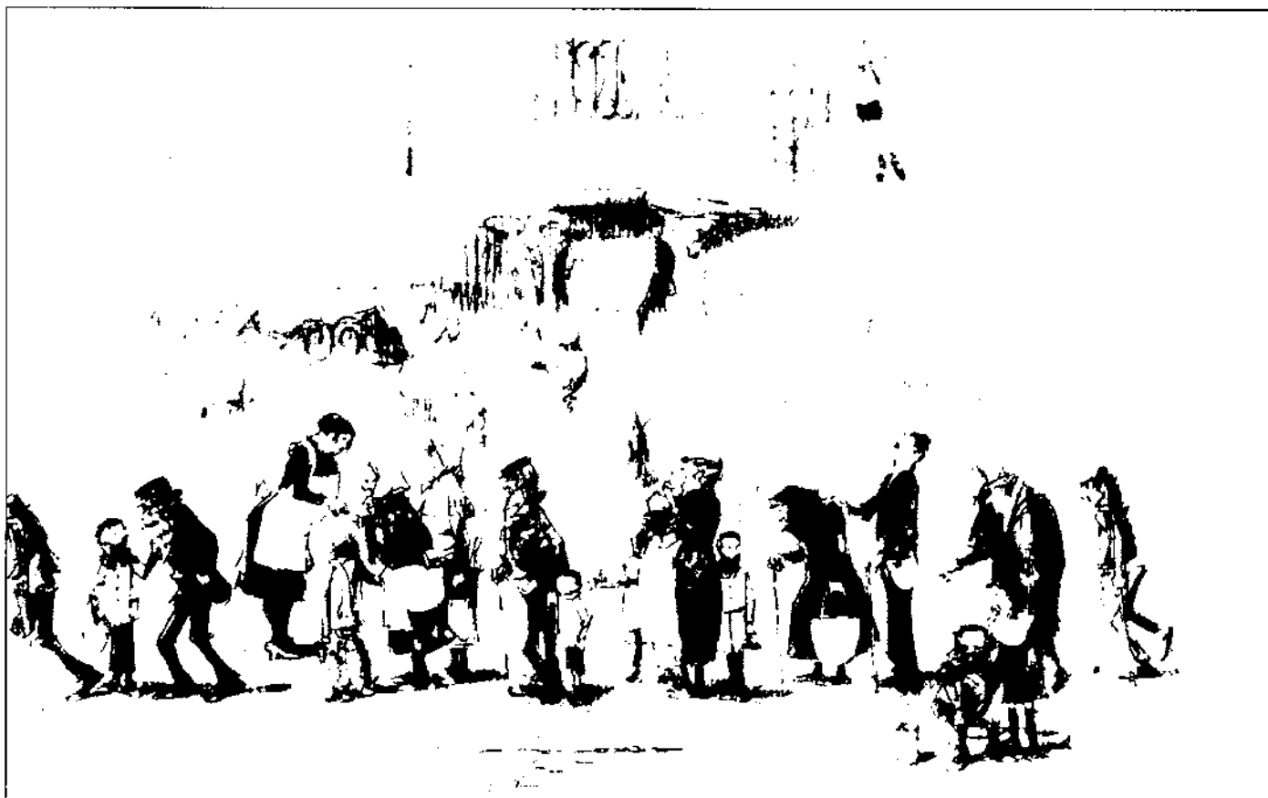
Captaires, dibuix d'Amador Gorrell. (Propietat del senyor Albert Murtra.)