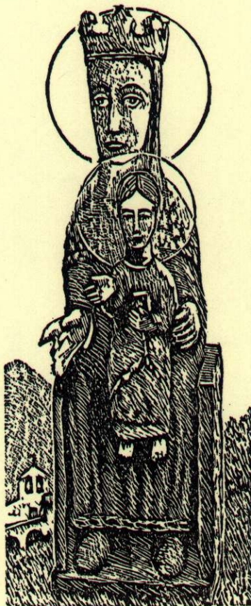
EDICIO PATROCINADA PEL MOLT IL·LUSTRE CONSELL GENERAL DE LES VALLS