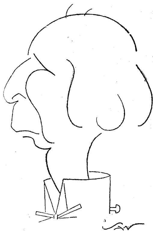
L'eminent pianista Emil Sauer