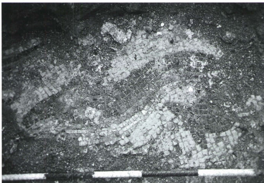
Dofí en opus teselatum , en el moment de ser extret. Aquests elements, conservats al Museu de Granollers, formaven part d'un nimfeu del segle I dC d'una construcció luxosa del nucli romà de Granollers.

sepultures d'inhumació, que confirmen l'extensió i la densitat d'aquesta zona funerària.